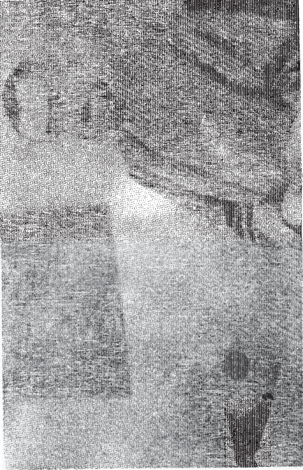
KADI MUHAMMED Iran Kûrdistan Demokrat Partisi (Î-KDP)'nin ilk başkanı