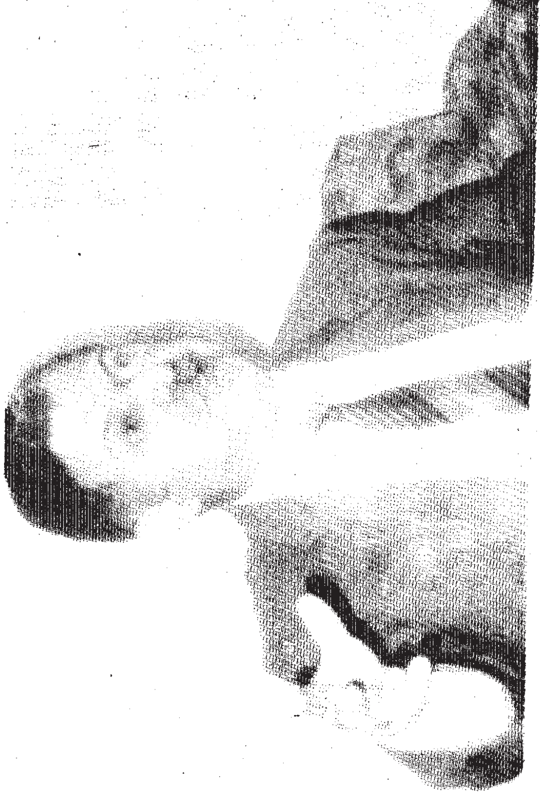
CELAL TALABANI Kürdistan Yurtseverler Birliđi (KYB)'nin kurucusu ve genel sekreteri