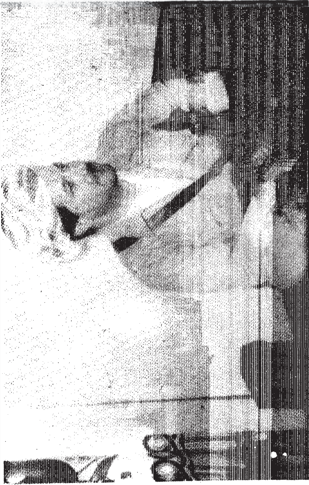
MESUT BARZANI Mustafa Barzani'nin ođlu ve halen I-KDP'nin genel bařkanı