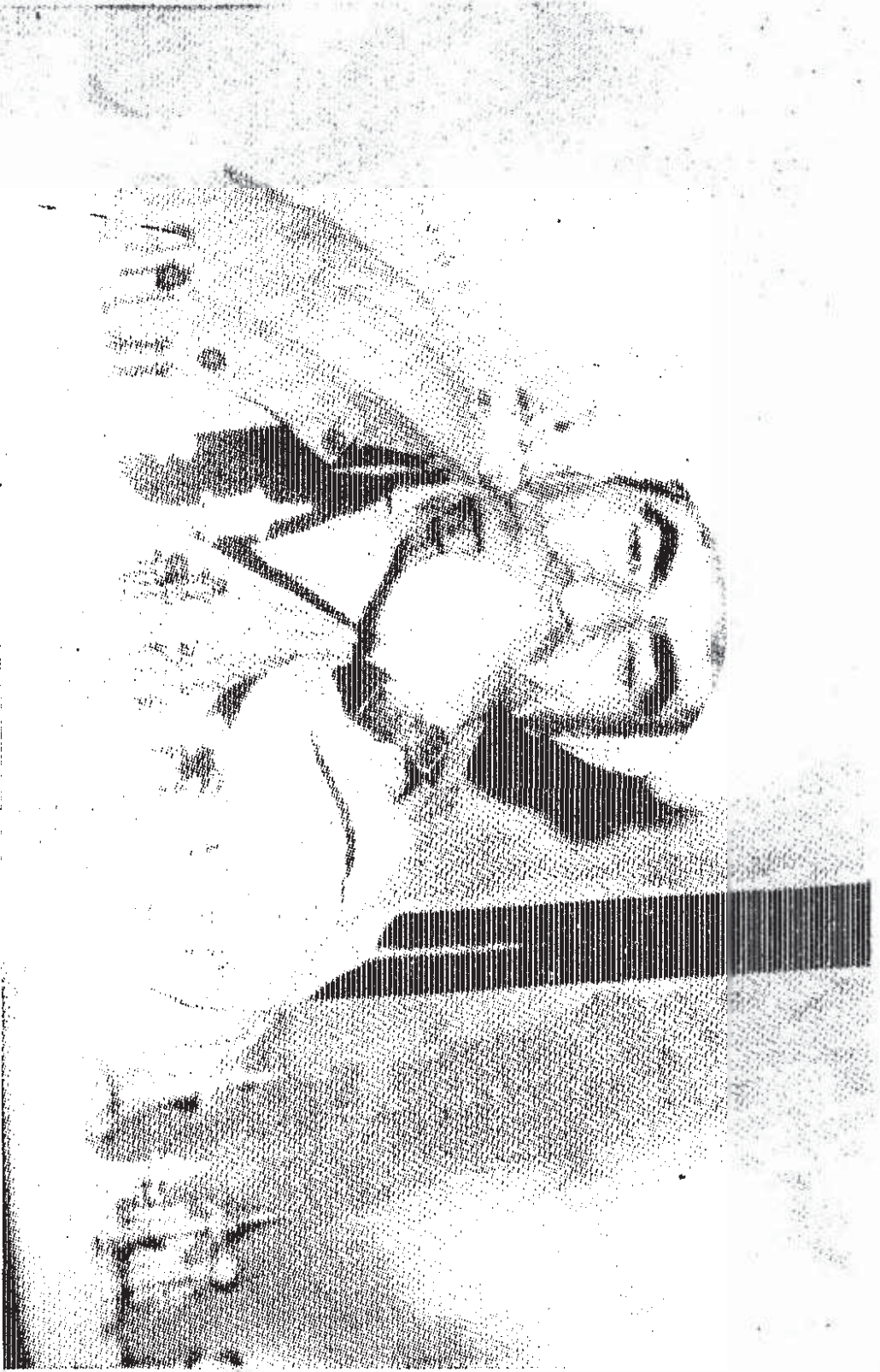
MUSTAFA BARZANI Irak Kirdistan Demokrat Partisi (I-KDP)'nin kurucusu ve ilk genel başkanı