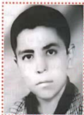
محممه دسه عید نه چاری (ناسق) - بۆکان (شاعیر) له ته مه نی ۱۰ سالی