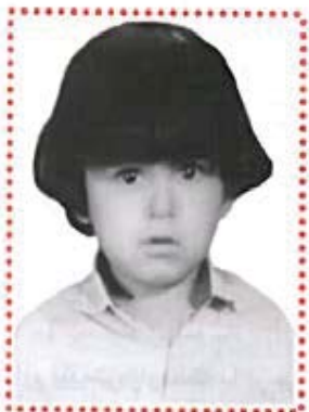
مه نووچیهر بوردل - مه هاباد (نووسهر) له ته مه نی ۲ سالی