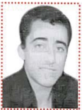
عه تا نه های - بانه (نووسهر) له ته مه نی میرمنالی