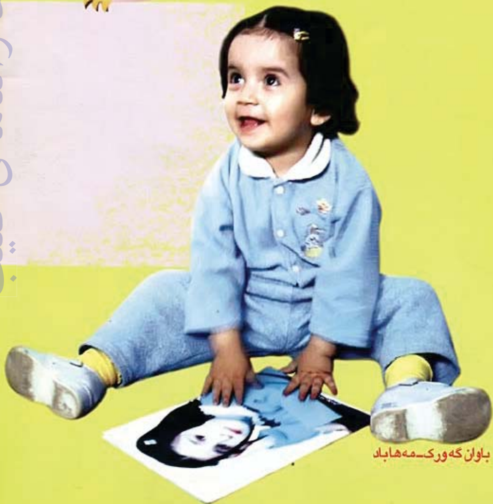
باوان گه ورک-مه هاباد