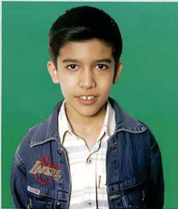
کیان که ورک - مه هاباد