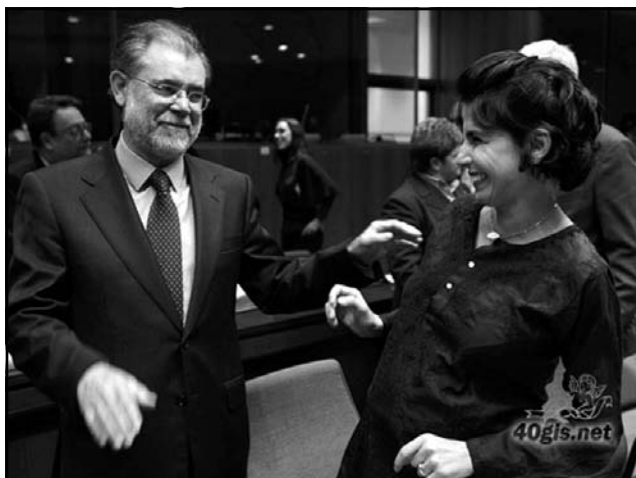
رهشیده له خۆزتی سه روک وهزیرانی ئیسپانیای پیتشوو