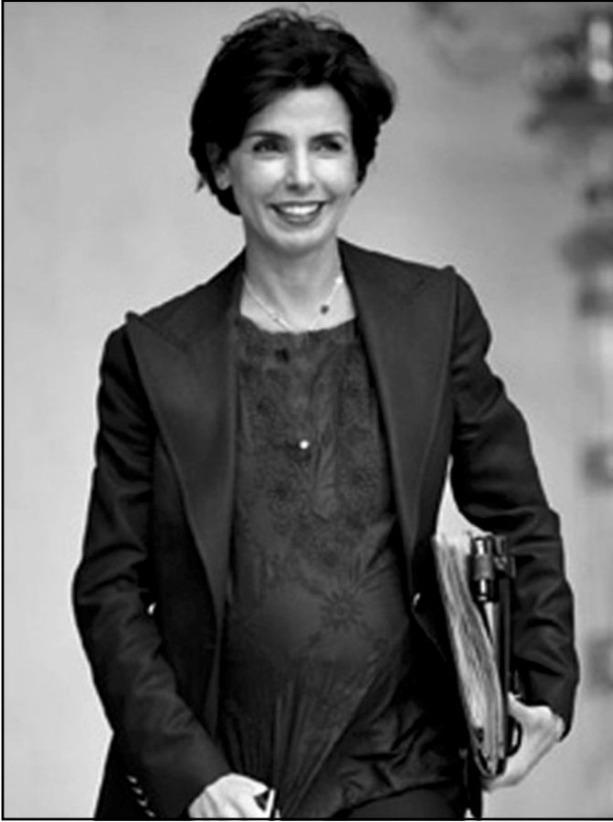
رهشیده پاش دەرچوونی له کلینکی منداڵبوونهکەهی، یهکسهەر بهشداریی کۆبوونهوهیهکی ئەنجوومهنی وهزیران دهکات