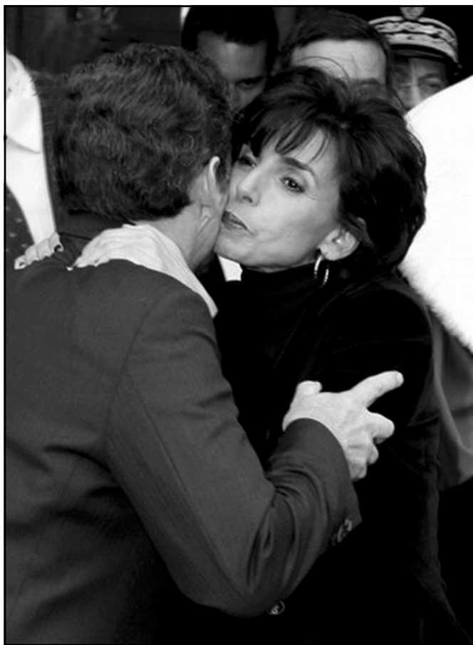
رهشیده و سارکۆزی په کتري ماچ ده کهن