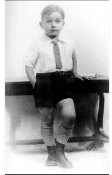
ئالان به منالى