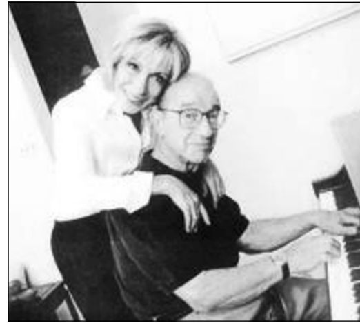
ئالان له گه ل ژنه ژورناليسته كى