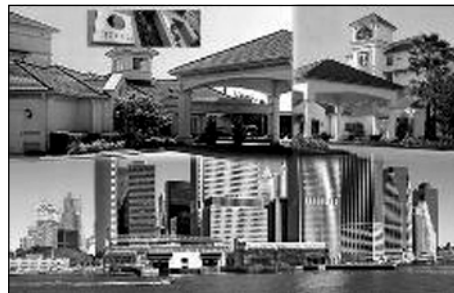
كۆشكە نازدارەكانى مىلياردىرەكان