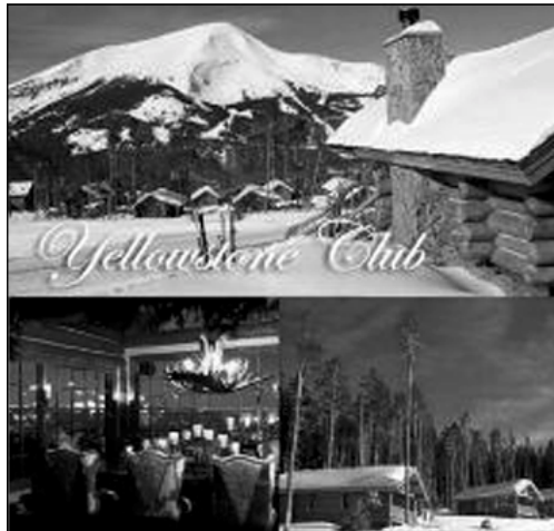
ٹارامگہ پیکہی ملیارڈیرہکان