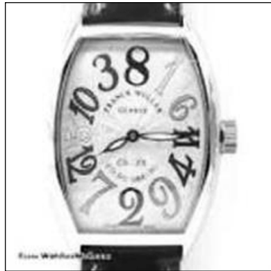
سەعاتە نامۆيە گرانەكە