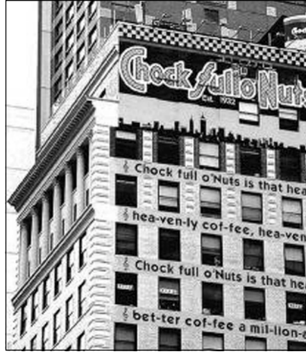
کافتریای دہولہ مہندہکان