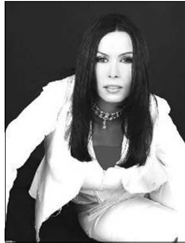
بەريۆبەرى ئامۆزگەى ستاركى