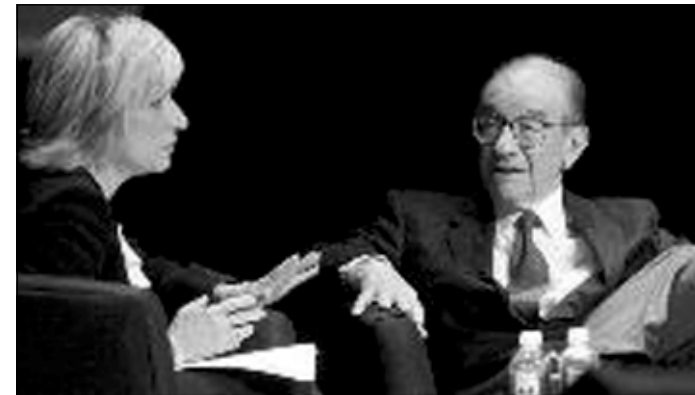
ئالان له ديمانه كى ته له فزيونيدا