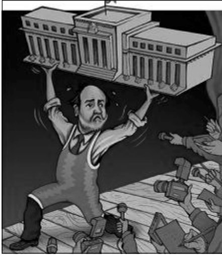
ریتشیسٹان و دہسہ لآت