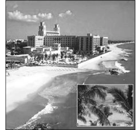
شویننی حہوانہی ملیارڈیرہکان