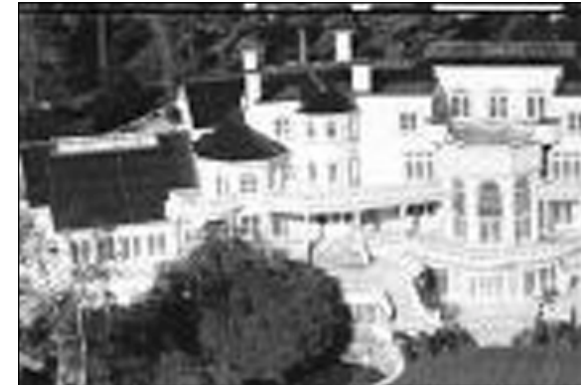
کوشکی ٹہ میریکی عہرہب