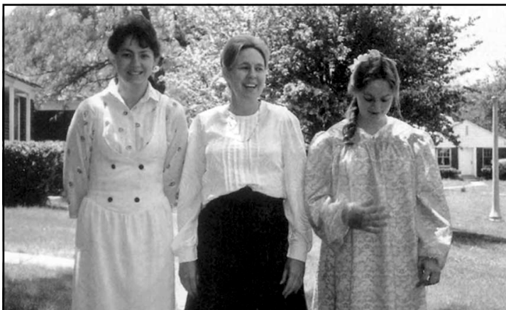
نووسه ره که له گه ئدایکی و لینه دای خوشکی