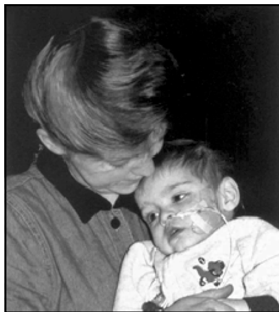
کارۆلین له گه ئ ئارسه ری کوری