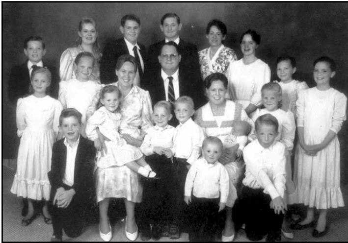
وینهی باوکی کارۆلین لهگهڵ ژن و منداڵهکانی خۆی