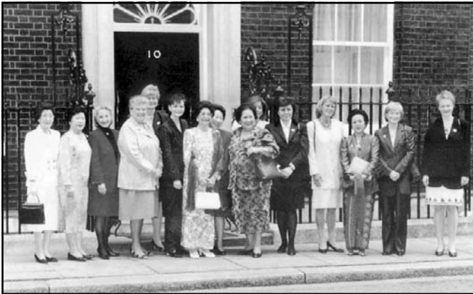
فلاڤيا له گهڼ ھاوسه رھکانی سهرانی به که تبي ئه وروپادا