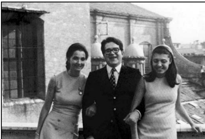
رۆمانو و لهگه‌ڵ دوو خوشکی خۆی