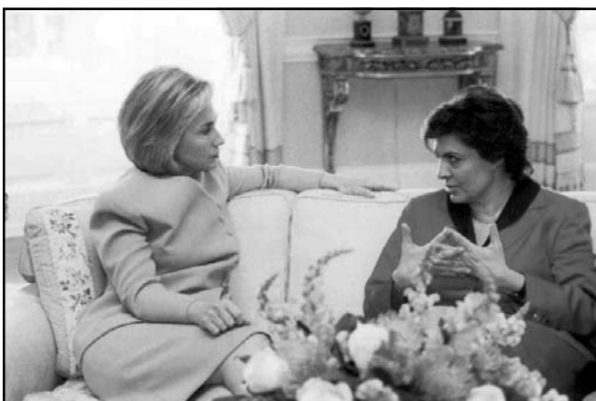
فلافيا له گه ل هيلارى كلينتون