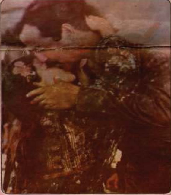
رابهری کاروانی سههرکهوتن سهروکی فهرمانه ههشال ههتام حسێن