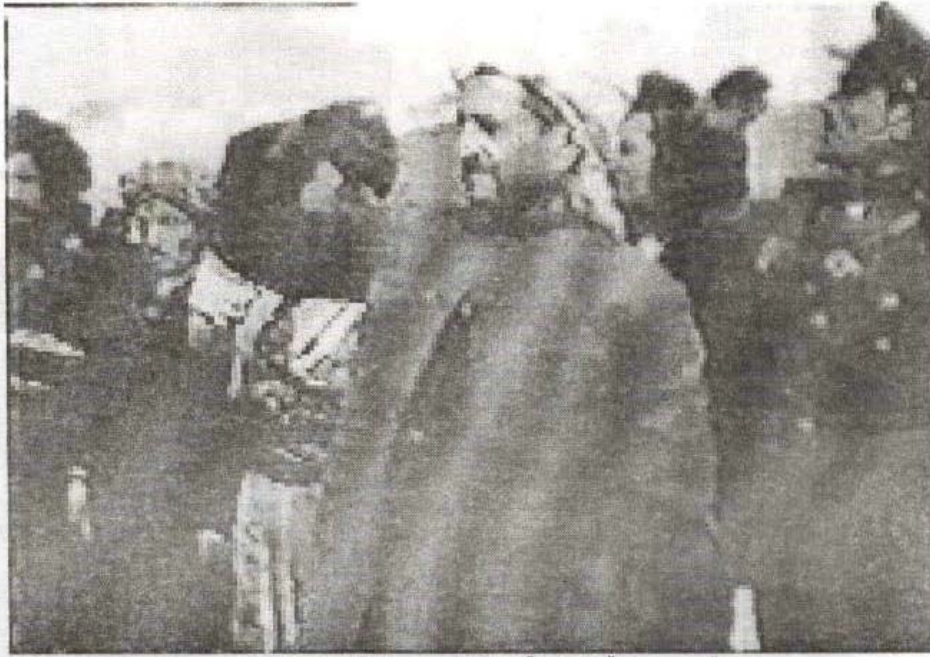
پیشهوا له حاله تی سلاوی کۆماری بۆ پیشمه رگه کان