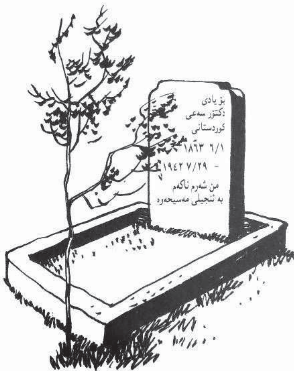
گۆرى دوكتور سەئى لە ھەمەدان