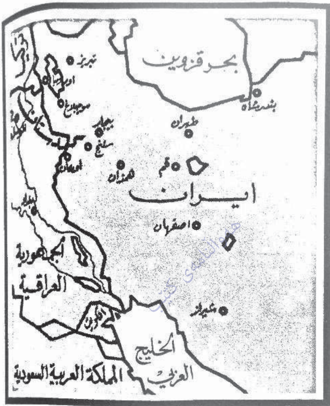
نه خشه‌ی تیران