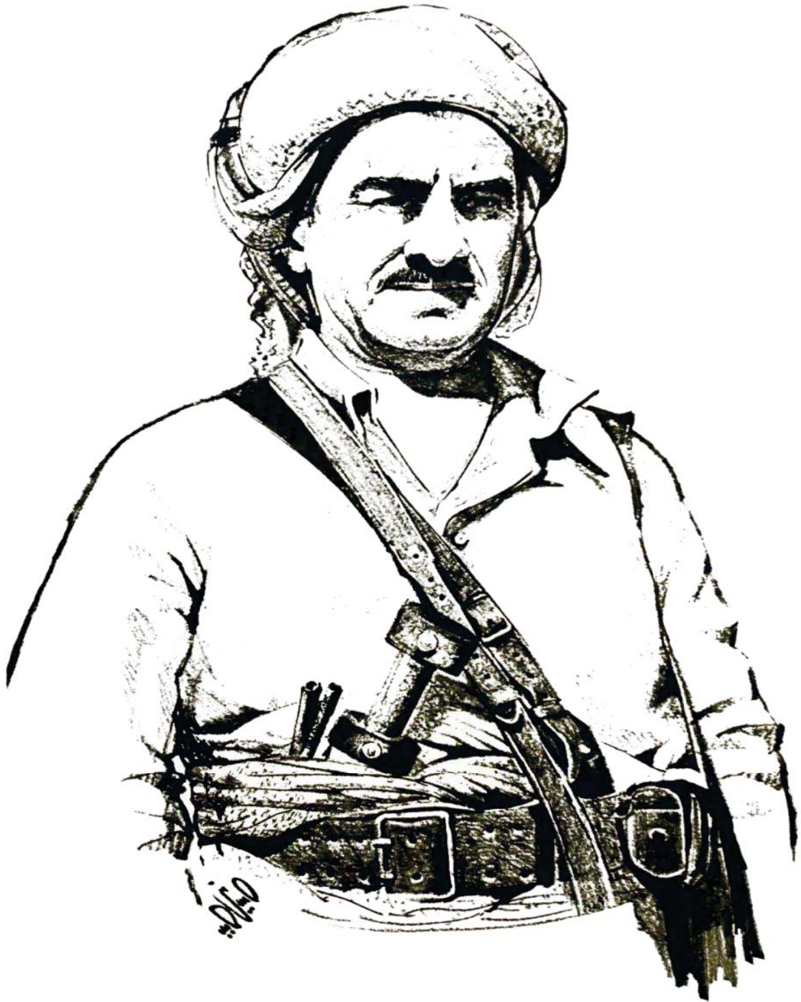
باوکی روحی و نه ته وه پی سه رۆک مسته فا بارزانی