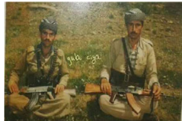
عه بدولکه یریم فه رحان که شانلی. عه بدولجه بار خواجه شیلانی.