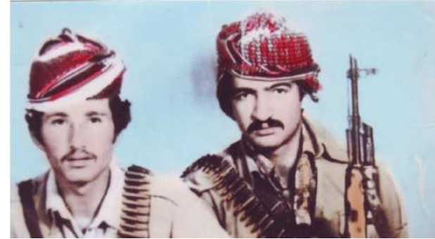
شهید: عه بدولجه بار خواجه شیلانی. شهید: مغاویر شیلانی ل سالا (۱۹۸۲) سی