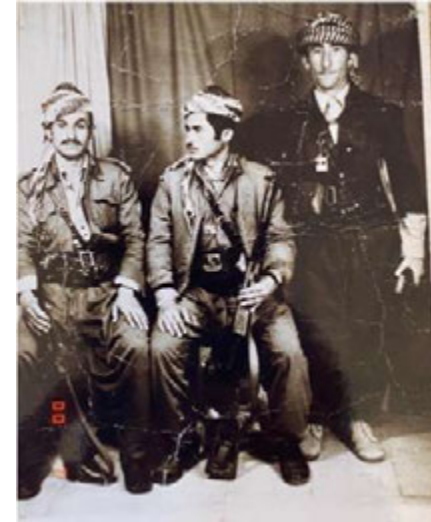
په سوول هه دریشی، محق گه ودا و نووری خدر.