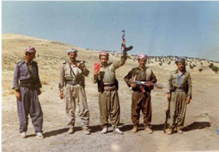
عیسا، عه بدوللا، محق گه ودا، سه بری علی و ته مهر بلدیشی.