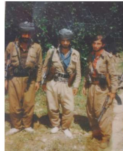
شهید: مغاویر شیلانی. شهید: عه بدولجه بار خواجه شیلانی. سه لمان سالح شیلانی.