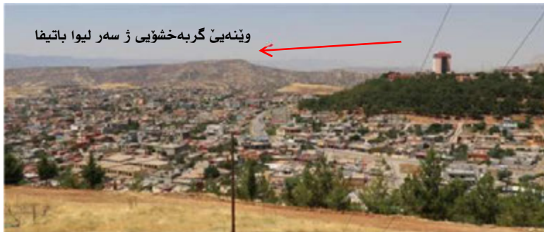
وینەیی گرەبەخشوی ژ سەر لیوا باتیفا

هژمارا (۴ - ۵) (RPG) یان و پرەشاشەیه کا ژ جۆری (گرینۆڤ) و تۆپەکا (۵۷) مەم د دەستی هیزین هەقال (محو گەودا)یییدا بوون (۳۱) .