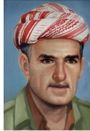
عومءر يووسف مءه مءء به رنياس ب (عومءرى له على) سه رپه رشتى داستانى.