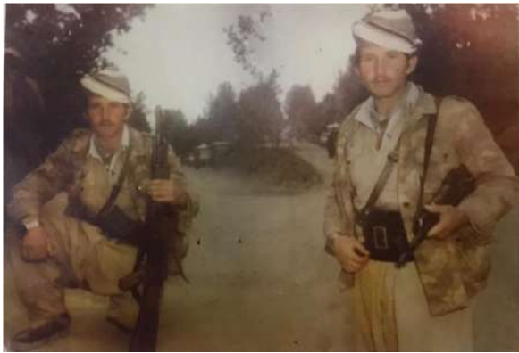
شەھيد مغاوير شيلانى ۱۹۸۳ ئىران.

ويئەيىن دەقەرا داستان لى ھاتىيە ئەنجاھدان