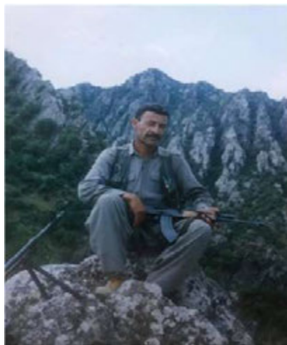
سه لمان سالح تەيب شيلانى