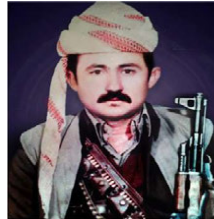
شه هيء: مءق گءءءا.