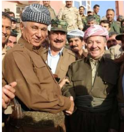
سەرۆك بارزانى، ئۆسمان قاسم و عەلى قادى شەرىئە داعش ل ساللا ۲۰۱۴-يى.