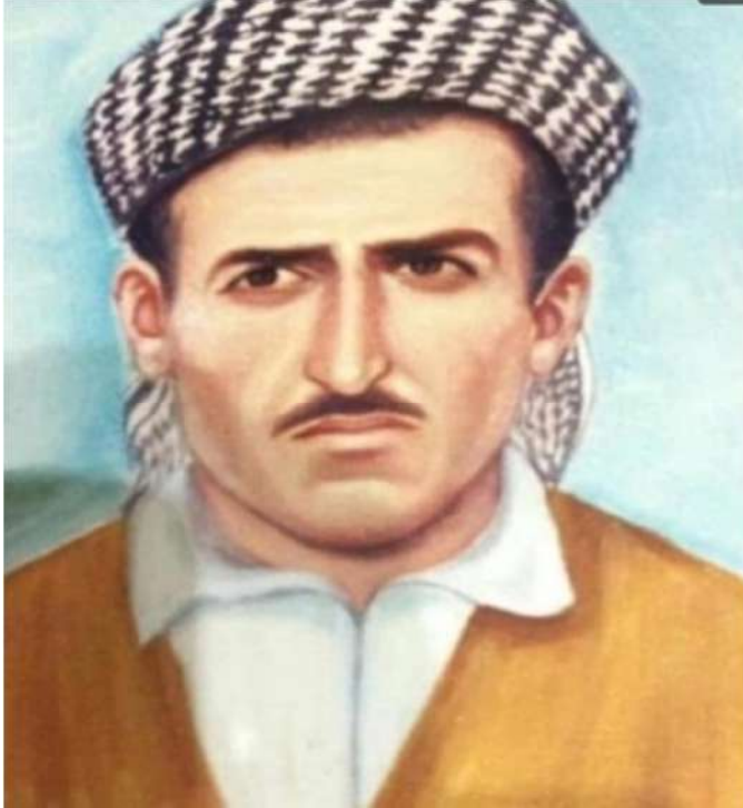
شه هيدى داستانى: نه حمه د يه حيا تهيپ.