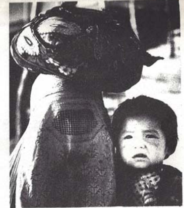
NİSAN DEVRİMİ, HALKI BU KARANLIK ORTAÇAĞ DEVRİMİNDEN KURTARACAKTIR!

İran'ın, Ortadoğu'da emperyalistlerin bir üssü oluştuktan çıkmasından sonra, ABD emperyalizmi 100 bin kişilik bir "itfaiye ordusu" kurdu. Bu ordu, emperyalistlerin çıkarlarını tehdit eden olayların çıktığı yere kısa bir zamanda derhal yetiyecek. Bu da ABD emperyalizminin saldığı ganiğini çok iyi teğair ediyor