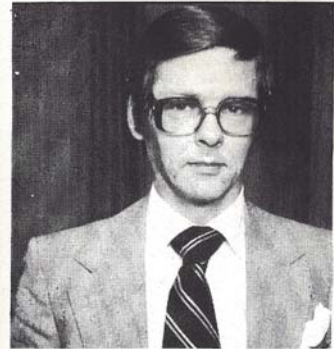
İSVEÇ DIŞ İŞLERİ BAKANI OLA ULLSTEN

Halen ABD, İran'ın en yakın komşusu Türkiye'yi sıkı bir şekilde tutmaktadır. Askeri bir saldırı olasılığı büyüktür. Bu durumda yirmi milyonluk Kürt halkı, emperyalist çıkarların al-