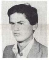
CUMA ATAMAN (1964)