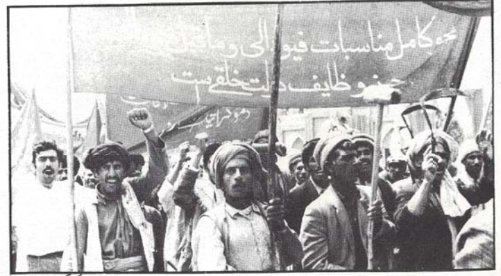
AFGANİSTAN HALKI NİSAN DEVRİMİNİ KARARLILIKLA SAVUNUYOR

Gerici güçler, Nisan Devrimini ne ve Afganistan halkına ihanet eden Amin vasıtası ile geçici olarak amaçlarına ulaştılar. H.Amin, bir komplo ile Afganistan halkının legal temsilcisi Nur Muhammed Taraki'yi katlederek başa geldi. İlk yaptığı işler, Nisan devriminin tüm kazanımlarını yok etmeye başlamak oldu. Binlerce ilerici, demokrat insanın kanına girdi. Onbinlercesini de hapishanelere doldurdu.