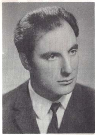
Ev hevpeyvîn sala çuyî dî meha Tirmehê de hatîye çêkirin.