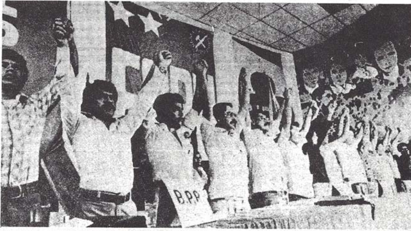
Demeke dîrokî : Bi avabûna Enîya Şoreşger a Gelêrî, nabe ra rêxistinên şoreşger de yekitiya xebatê çêbû.

Li welatê Amerîka Navîn El Salvador rê naha şerekî hundur destpêkirîye. Lî alîkî cûntake leşkerî, ya ku bi her awayî pişt a xwe daye emperyalîzma Amerîka, li aliyê din jî hêzên gelêrî yê demokratîk hene û şer dikin. Cûnta leşkerî bi hemû hêza xwe dajo ser hêzên şoreşger. Lê ew êriş û zordestiya cûnta leşkerî hêzên welatparêz nêzî hev dike.