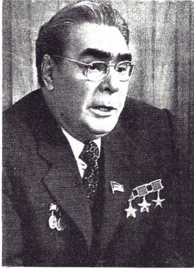
SBKP Genel Sekreteri L.I. Brejnev

Lenin'in kurduğu Sovyetler Birliği Komünist Partisi (SBKP), 23 Şubat - 3 Mart 1981 tarihleri arasında dünya komünist hareketinin tarihi bir kongresini daha yaptı. Parti kongresi, Sovyetler Birliğinin attığı güçlü adımları, sarsılmaz mücadelesini, emperyalizmi her konuda alteden bir sistem öncülüğü yaptığını bir kez daha kanıtladı.