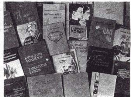
CELİL AİLESİNİN YAYINLANAN ESERLERİ

Onun, eski evi Sovyet Ermenistan'ında yeniden yaşıyor. Son 60 yılda, halkın kültürünü şekillendiren yeni bir Kürt ailesi doğdu.