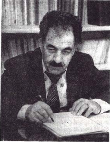
BÜYÜK OZAN CASİME CELİL