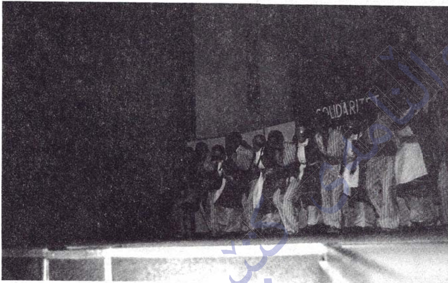
KOMA FOLKLORÊ YA KOMELA ME D E L Î L O GOVENDÊN HÊLA BEDLÎSÊ PÊŞKÊŞKIR

tên vexistin. Ev meşalên han, çirûskên azadîxwaziyê û serhildanê teze dikin.