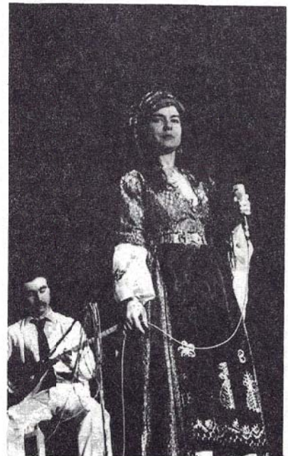
STRANVANEKE WELATPARÊZ Û GELEK DENGWEŞ: ŞİRİN

13. Bi def û zirne û govendeke tevayî, dawîya şevê hat.