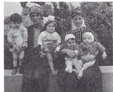
MÊR Û JIN ŞAKİRÊ EBO Û FERZA ÜSIV TEVÎ TORINÊN AWE

Niha gelek stîranên wê radioa meda hene, ew usa jî wek artist radiopî-şên kurdada dilîze.