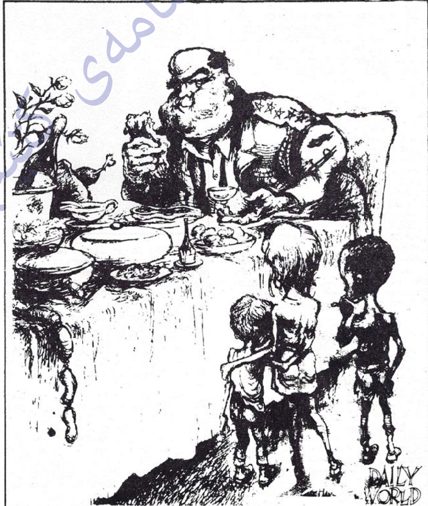
Tabi çocuklar, aç olduğunuzu biliyorum. Fakat sizleri koruyabilmek için biz askerler kendimizi formda tutmalıyız.

Barış ve silahsızlanma için verilen mücadele ABD emperyalistleri ve ittifakçılarının planlarını ve hedeflerini kesin bir şekilde açığa çıkarmadan verilemez. Her silahı olanı değil,silahlarmayı zorlayan diğerlerinden ayırmalıyız.Savunmak için silahlarmayla değil,saldırmak için silahlarmayla mücadele etmeliyiz.O zaman gerçekten doğru bir mücadele vemiş oluruz.