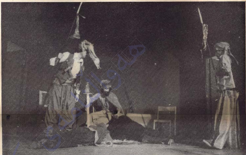
DEMBEK JI PÛYESA "DAWIYA DEHAQ"

Ji Elmanya Federal: Komkar, AKSA, Komela Karkerên Kurd li Frankfurt, Komela Karkerên Kurd li Berlina Roj- awa, Komela Karkerên Kurd li Bremen, Komela Karkerên Kurd li Duisburg û Komita Arikariyê bo Roja Welat li Elmanya Federal mesajên piştgirti û pîrozi şandibûn.