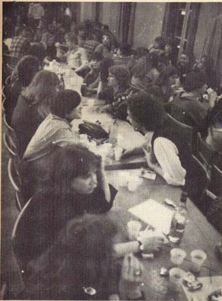
ŞEVA NEWROZÊ LI STOKHOLMÊ