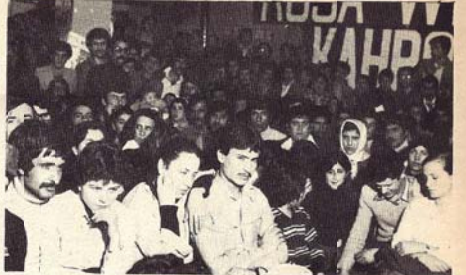
ŞEVA NEWROZÊ LI IZMİR

Her çiqas Hukûmata Tirk bi zordestî û hovitiya dixwaste rê li bigire jî, şevên Newroz li gelêk bajarên Kurdistanê û li bajarê Turkiyê, İzmirê hatin saz kirin.