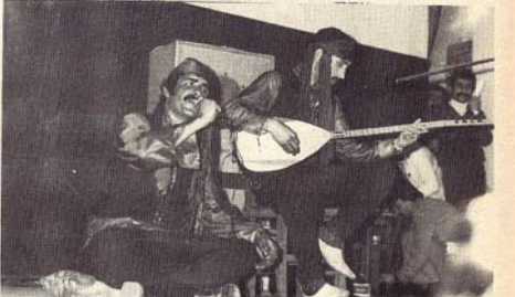
LENGBÊJEK KURD JI ŞEVA AZADIYÊ LI LIYARBEKIR

23 ê Adarê li İzmirê, li dor 1500 kes jî kedkar û xwendekar hatibûn şeva Newrozê. Di şevê de li gel programê zengin piyasa "Dawiya Dehaq" jî hate pêşkeş kirin.