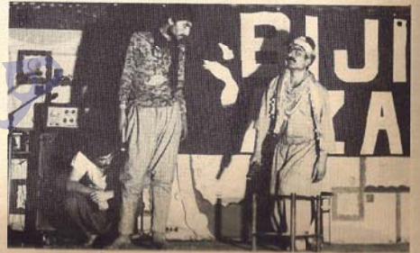
"DAWIYA DEHAQ"JI ŞEVA IZMİRÊ

Her çiqas Hukûmata Tirk bi zordestî û hovitiya dixwaste rê li bigire jî, şevên Newroz li gelêk bajarên Kurdistanê û li bajarê Turkiyê, İzmirê hatin saz kirin.