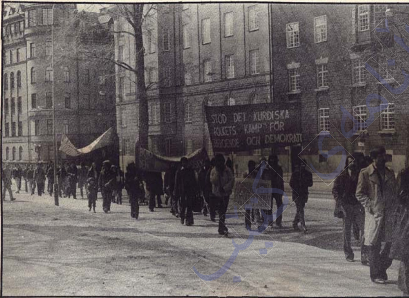
Demek ji meşa dij sazûmana leşkerî di nav bajarê Stockholmêra diçe sefaretê hakûmeta nijadparêz (Tirkîyê)