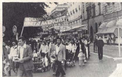
DEMEK JI MEŞA DJI SEFARETA IRAN LI STOCKHOLM

Li Stockholmê hemû wêlatparêz û sosyalîstên Kurd, qetilkirîna gelê Kurd protesto kar Daxûyani jî Sergelstorg dest pê kir, ber bi aliye sefaretê Iranê meşiya. Gelek demokratekên jî Swêd û yêr dîrî protestoyê de bejdar bûn. Li ber sefaretê, siyaseta Komeynî a kevnesperest û qetilkirîna gelê Kurd û her usa jî zordariya ser hêzen pêşverû li Iranê hate protesto kirin. Li ber sefaretê manostayê mezin Cigerxwin bi televizyonê ra ser rewşa gelê Kurd xebarda.