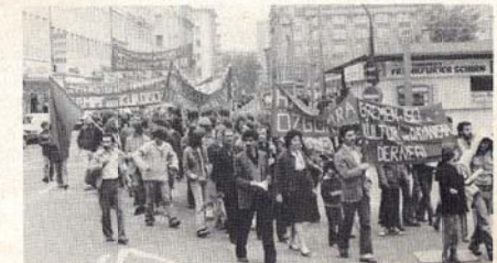
DEMEK JI DAXUYANIYA KOMKAR Ü AKSA LI FRANKFURT

Dî wan daxûyaniyanda gelek hezên pêşverû û demokratek bejdar bûn.