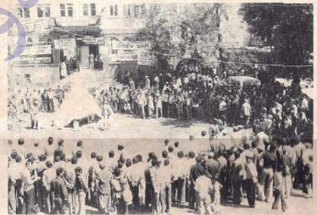
GELÊ DİYARBEKİR Bİ DİLŞOZİ PİŞTİGIRIYA

Lê pîndam (engel) û dijwariyên hemberî grêvê karkeran feda neda. Jî serî ta dawiyê dijî siplîna dî nav karkeran da û serwêriya Ge-