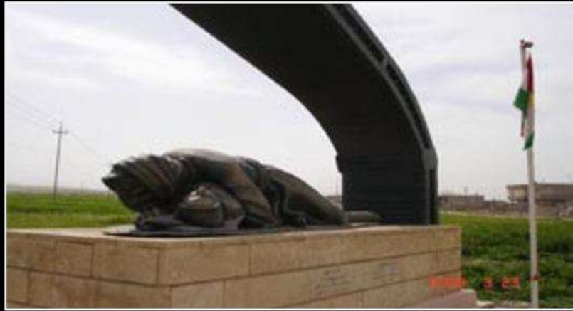
پهیکری نوهری خاوهەر و زاروکی وی، قوربانین چەکی کومکوژی ل بازیری هەلهبجە.

فرانس فان ئانزات دا. ۴- چارسه ریا بریندارین چهکی کومکوژی. ۵- پاقرکونا دهقه رین پیسبوی بچهکی کومکوژی. 6- بهشداریکرن دئافاکونا دهقه رین پیسبوی بچهکی کومکوژی. 7- ۱۶ ئاداری بیته روژا قه دهغه کرنا چهکی کومکوژی ل جیهانی. 8- نه ته وهین یگرتی داخوازا لیبوری ل ملهتی کورد بکته ژ بهر بیده نگبونا وان بهرام بهر فی تاوانا مه زن. چونکو هتا نوکه پروتیسنا فی تاوانی نه کره.