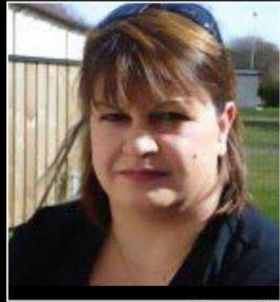
کوچهر ناھیدی خوشکا شههید بورهان

هدر داستانه کا قاره مانی ته لگهل هه قالین خو بین پیشمه رگه پشکداری تیدا دکر ته پارچه ک ژ وی جهی د گهل خو د نینا. نه و له شی وهسا بی نازک و دهلال تهف ته ژ بی برین و گولین دوژمنی ببوو. مه باش دزانی کو وهکی هدر ههفت جارین دن فی جاری ژی تو بی برین و خوین ناغه گهری بهر چاقین دهیکا عهیش لی مه نه زانی بوو فی جارئ گولله یا دوژمن و خیانه تکاران ل روژا ۱۱ / ۱