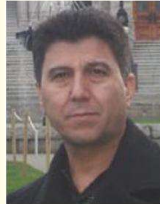
نارام دھۆكى - كەنەدا

بەكەتە دەولەت دڤت خۆ ژ پتر ۲۰ دەولەتتەن دوتيايى بگە ل جھەك مينا رۆژ ھەلاتا ناڤين ئەڤە ژى كارەك نە بساناھىيە، نە بو ئەمريكا، نە بو چ ھەلاتان كو فى ئىكى بگەت. ژبەر فى ئىكى ژى سەرخۆبوونا كوردان ھەر گریداھ بگوردان ڤە، د بيت ھەلات ھەبىن پشەتە قانیا كوردان بگەن ل ڤر، ل و، چ بو بەرژەوھەندىن خۆ، يان ژى باوھرى بگيتشا وان ھەبىت لى يا راست (بىدەر ھەر خەما بايە) كيتشەيا كوردان ھەر خەما كوردانە.