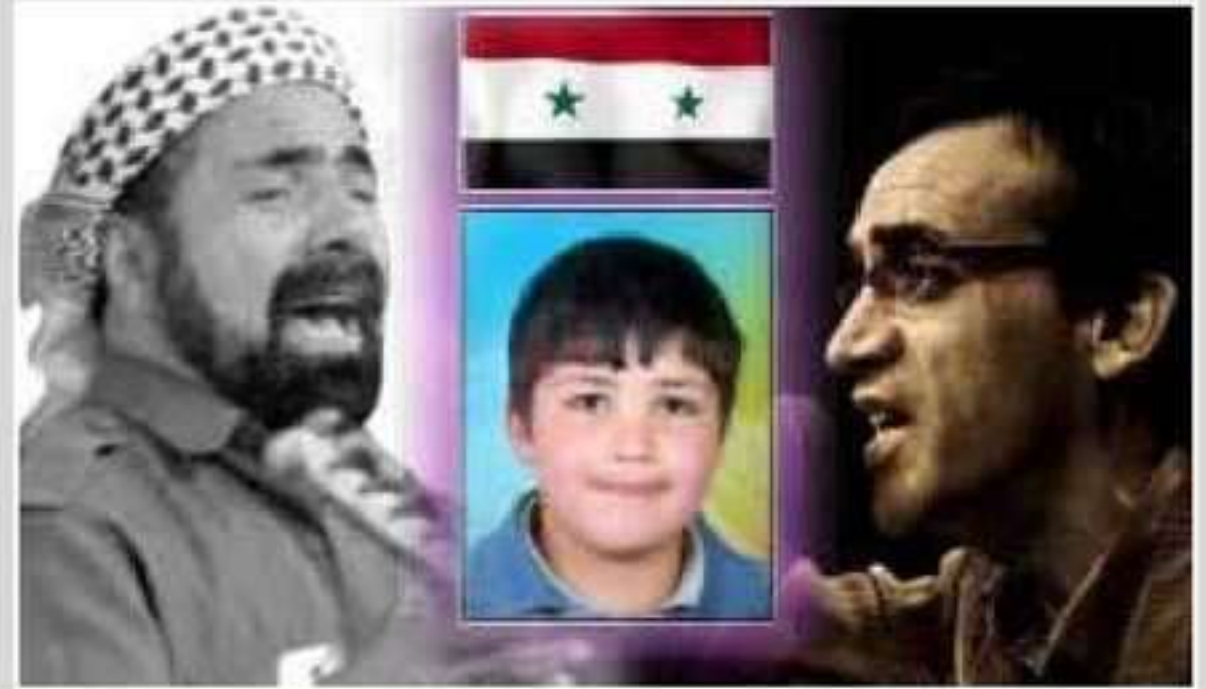
شقان پهروهه سترانا ب زاروکین سوریا یی دبیژیت