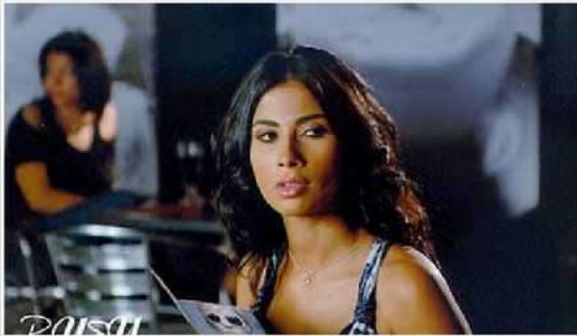
حهزا کوران کچییت رهش نهسمه رن یاکچان ژی کورین بهژن بلند و لاون