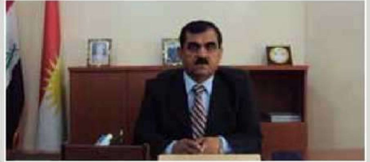
ریژه بهری ناحیا دیره لوک: باشترین چاره بو خانیین ناخی پیدانا سلفا خانوبه رانه.