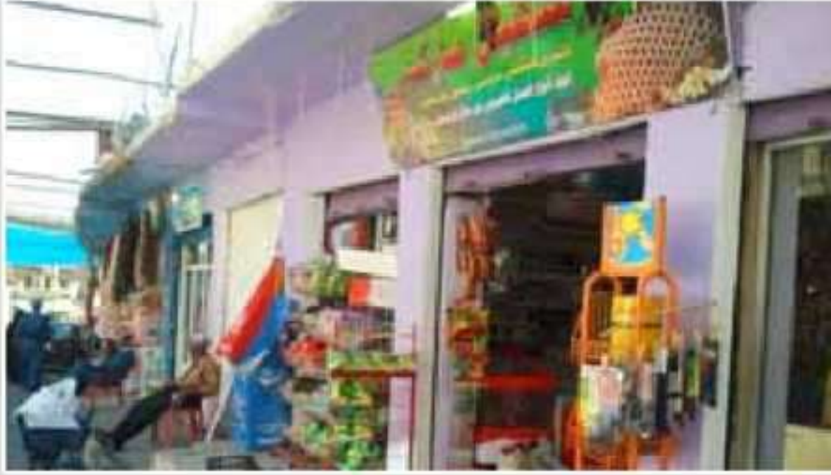
بازاری نامیدی دناقبهرا دوهی و نهقرودا

کوقارهکا هه یقانه یا رهوشه نیری گشتی یه ل نامیدی دهر دکه قیت