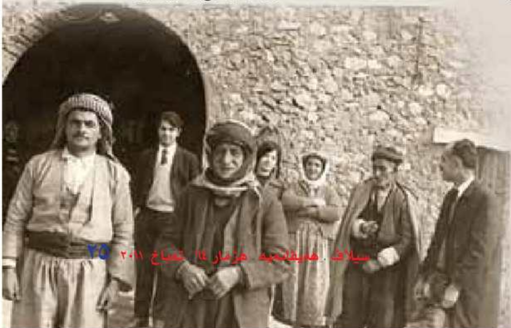
سیلاف ههلبژارتیه هژمار ۱۵، نساخ ۲۰۱۱

سهروکی لیژنا کاروبارین نهرمنه نان تهکهزکر کو وان تا نوکه چ هول و بنگههین رهوشهنبیری نینن، لهوا داخواز دکهن بو وان بهینه دابینکرن. گوت ژی «مه هولکه