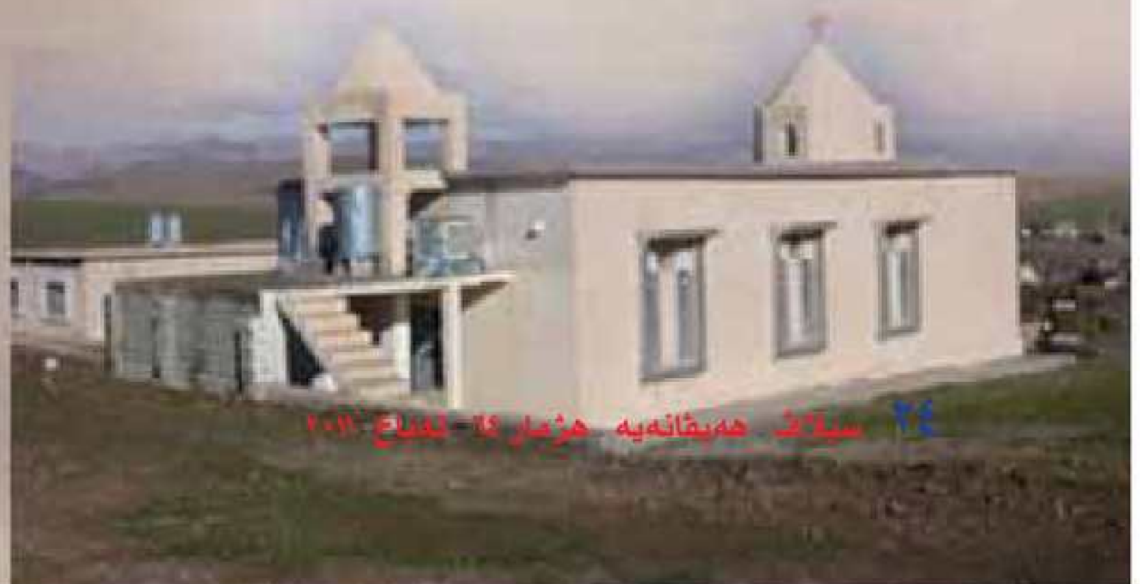
۲۹ سیلاڤ هه بیقانه یه هزار ۲۵ - نهرمه ن

سه عید حه جی سه دیق کو په رتوکا، زاخو که فن و نوی، دروستکریه تاییه ت بوسیلاڤ گوت: ژبه رترسا عوسمانیان گه لهک ژ نهرمه نا ببوون موسلمان وه ختا سپیدی وان گول دهنگی زهنگا دیرا زاخو بوون، بو وان دیار بوو ئه ف باژیره یی ته نایه چه جوداهی