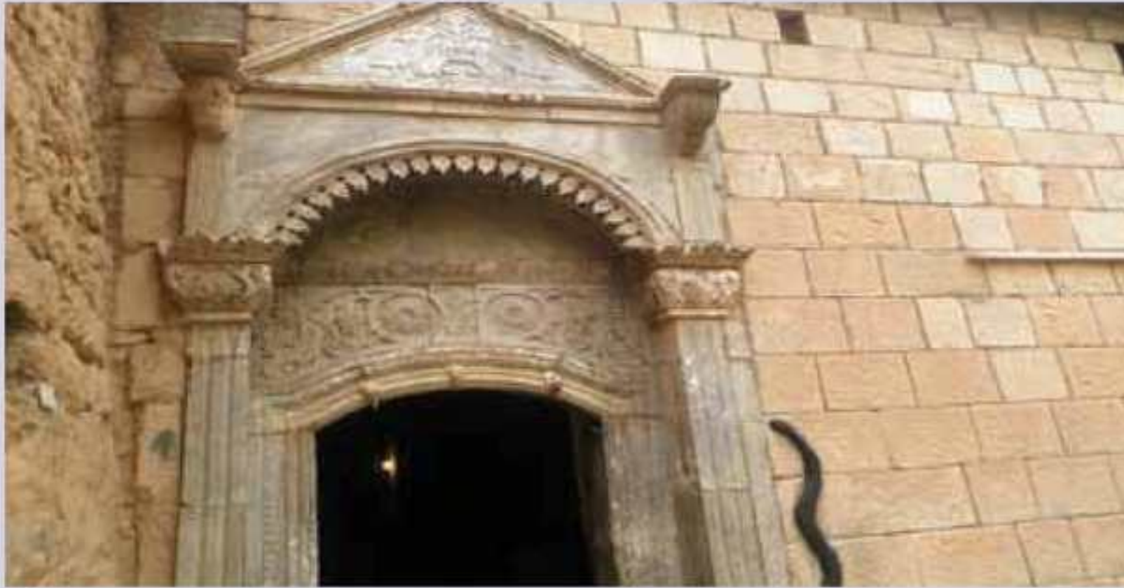
جهیت ژ لالشی پیروژتر نهخاسمه ل نک ئیزدیان نینن.

چهند جارا و د چهند دهلیقادا، من سهره دانا لالشی کریه، ههرجار گهلهک تشتا تیدا بالا من راکیشایه، لی فی جاری پتر ژ ههمی جارا پسیار ل سهر لالشی و ژ وی ئولی د فیتریدا ژ کانیا سپی دهردکهفیت، پسیار بو من دروست کرن، لی بهرسقا فان پسیارا پیدفی قهکولینیت گهلهک هوبر و کویرن!