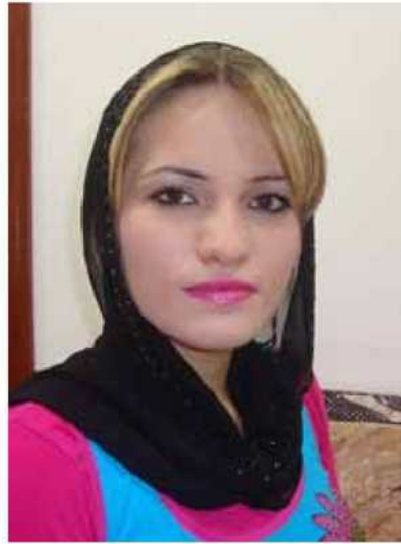
شه هلا ریکانی

شوپکرن و ژن ئینان ئیک ژ بریارین هه ره گرنه کو کچ و کور هزر تیدا بکهن، ژ بو هندی کو هه دوو رهگهز بگه هه بریارین ساخه لم و دروست و د ژیه کئی گونجایدا خیزانی پیک بینن، ژ بهرکو زوی شوپکرنی و ژن ئینانی تاریشه هه نه و زوی نه شوپکرنی و ژن نه ئینانی ژیه هه تاریشه بین خوه هه نه. ئەف مانشیتتی ل سه ری دیار، گوتنه کا فره نسی یه و تاقری ب زوی شوپکرن و ژن ئینانی و دیسان ده رنگ شوپکرنی و ژن ئینانی دکهت کو هه تا ئەف چه نه هاتیه دیارکرن ژلایئ زانستی فه، ژیه باش بو کچی کو تیدا شوی بکهت ۱۸ سالیئ تا ۲۵ سالیئ یه و بو کوری ژیه ۲۰ سالیئ و یقه ژنی بینیت، لهوا پیدقیه هه ردو رهگهز هزر د ژیه کئی گونجایی دا بکهن، ئانکو