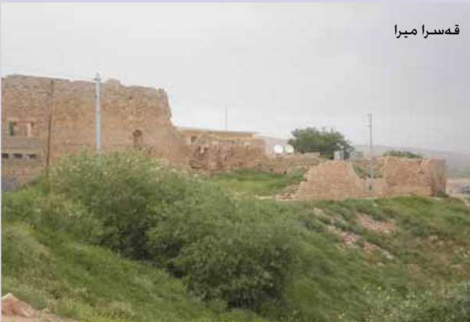
قه سرا میرا

ریفینگیا ب باله فرا بو من ئه قینه کا تیدا هه ی، نه ز ئه سمانا دبینم، نه ردی دبینم، نه فرا وه کی تلخیت به فری لسه ریک