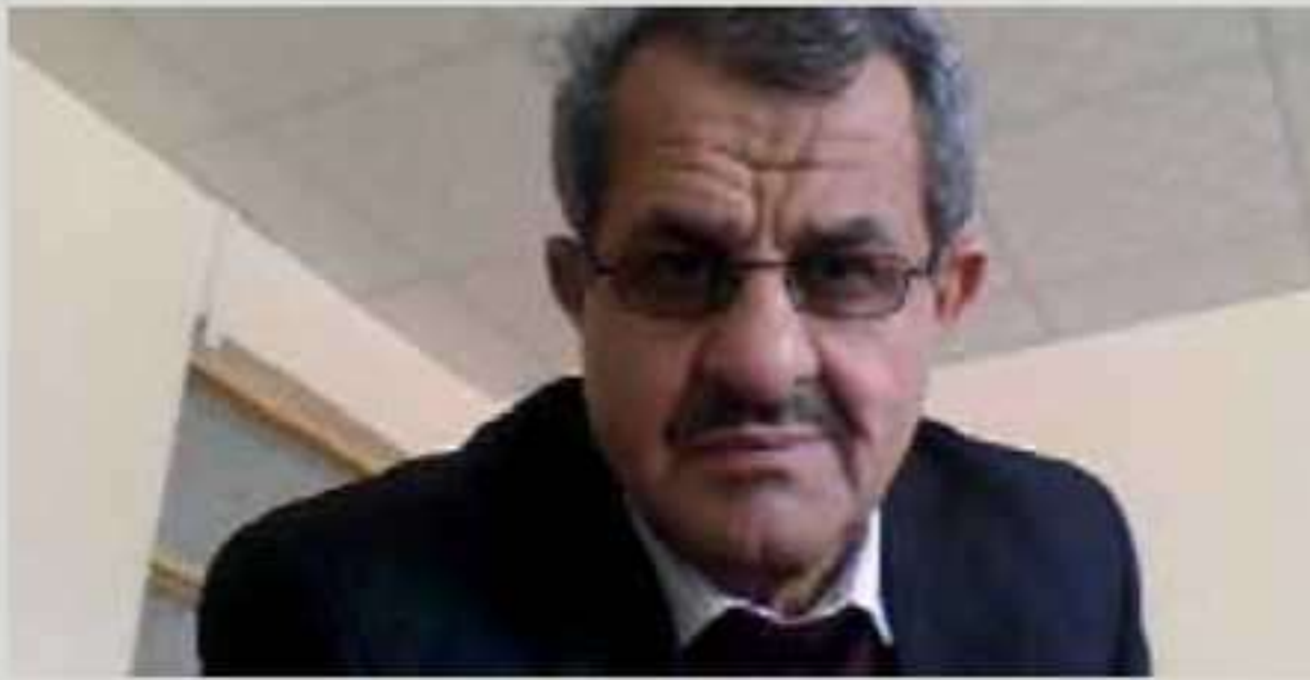
که‌مال ئاکره‌یی بو سیلاف د په‌یقیت

کوفارهکا هه‌یفانه یا ره‌شه‌نیری گشتی به ل ئامیدی دهرده‌قیت