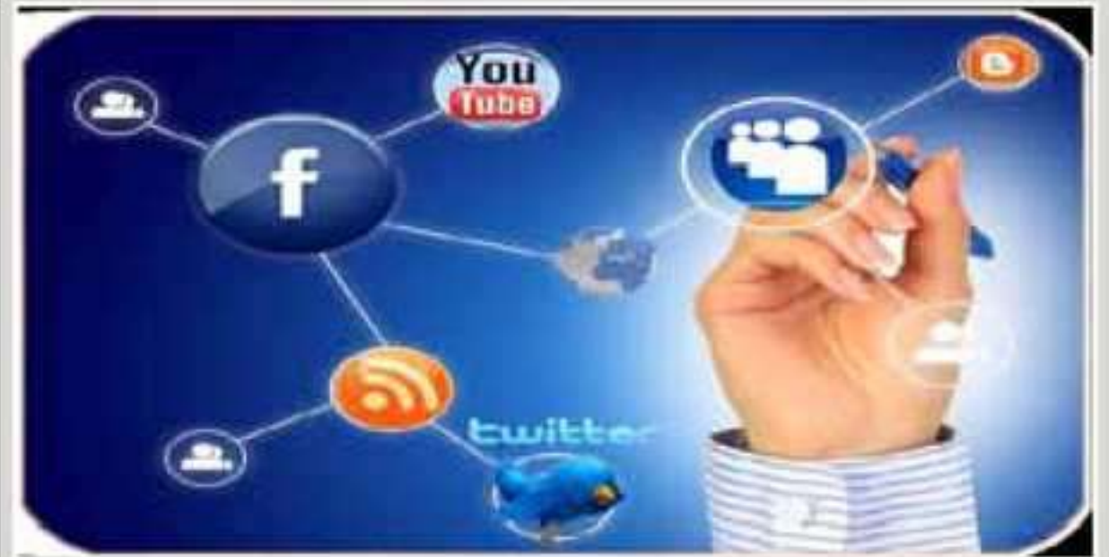
راسته ته‌کنولوژیایی ده‌ست دگه‌ل هه‌لکرنا شوره‌شین به‌ارا ئه‌ره‌بی هه‌بوو ؟