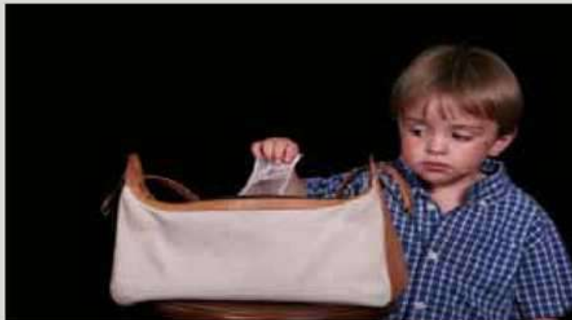
چه‌ند شیره‌ته‌ک داکو زارویی ته‌ فی‌ری دزیی نه‌بن