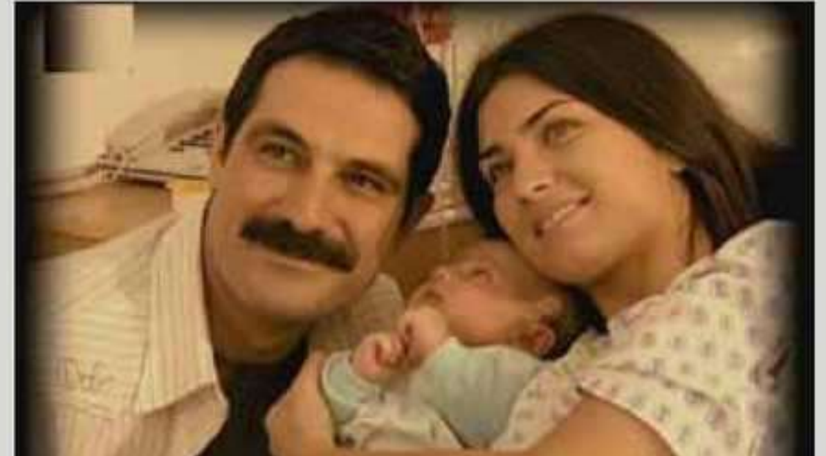
بوچی ب تنی ئه‌م ب چاقه‌کی ته‌ماشه‌ی زنجیره‌ییی دوبلاژکری دکه‌ین ؟