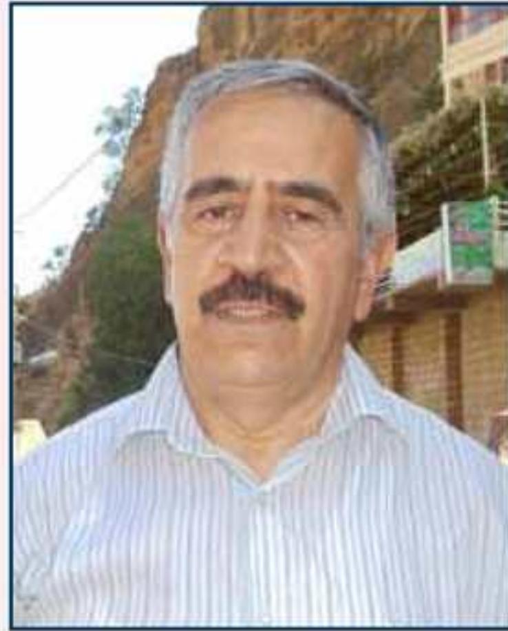
موسه دهق توفی

خواندنگه‌هی ۳۱ خویندکاران دهوامکریه، بهلی ئەفه وی چەندی ناگههینیت کو بهری هنگی کچین گوندی نه‌چووینه خواندنگه‌هی، چ ژ فه‌گیرانین خەلکی گوندی چ ژ راپۆرتین پشکینه‌ران دیار دبیت کو بهری هنگی ب چەند سالان کچین بامهرنی ل خواندنگه‌ها سهره‌تاییا کوران خواندینه. د هه‌مان راپۆرتدا هاتیه: خواندنگه‌ه بۆ سالا بیت پیدقی ب هۆبه‌کی یه بۆ ریزا دووی و هوبه‌کی یه بۆ ریزین سیی چواری کو ژ خواندنگه‌ها کوران بیتنه فه‌گواستن. (۴) د نقیساره‌کا ده‌سپیکا سالا ۱۹۵۹ یا ریشه‌به‌ریا په‌روه‌ده و فیرکرنی ل لیوا مووسلی بۆ قائیمه‌قامیا تامیدی دا هاتیه کو ژ ده‌سپیکا قی سالیقه‌ ئانکو ده‌سپیکا سالا خواندنی ۱۹۵۸-۱۹۵۹ فه‌ خویندکارین کچ ل ریزین سیی و چواری بیتن خواندنگه‌ها بامهرنی یا کوران هه‌نه. (۵) ئەفه ژ وی چەندی دگه‌هینن کو بهری فه‌کرنا خواندنگه‌ها کچان خەلکی بامهرنی یی فه‌بووی بوویه بۆ چوونا کچان بۆ خواندنگه‌هی و ئەفه ژ ی پالدەر بوویه بۆ فه‌کرنا خواندنگه‌ها کچان ل قی گوندی.