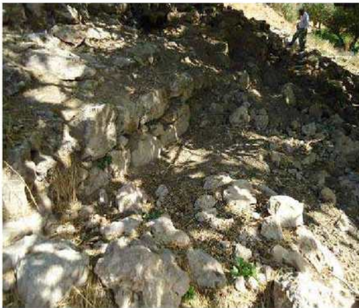
ديواری برکا پاشای

ل سه‌ری مه‌تيني و ل هنداف ئه‌ره‌دنا و ل سه‌ری کومه‌ته‌کی بلند چه‌په‌ری (ميترکی بلباس) دکه‌قيته به‌ر چاڤين مروقی، خالا سه‌ره‌کی یه و خالا ستراتيژی یه بو زالبون ل سه‌ر ئه‌ره‌دنا و ده‌قه‌را بورجا به‌په‌ره‌می، چه‌په‌ری ميترکی بلباس ژوره‌کا گروهه‌ ب ديوارين مه‌زن هاتيه دروست کرن ب به‌ر و کسلا، بلند ترين خال ژي مای (۲۰، ۱م)، تيريی بازني وی (۲، ۵م)، ژبه‌رکو گه‌له‌ک گوهورين ل سه‌ر ئه‌فی چه‌په‌ری هاتينه کرن مروث نه‌شيت وه‌کی پيدقی