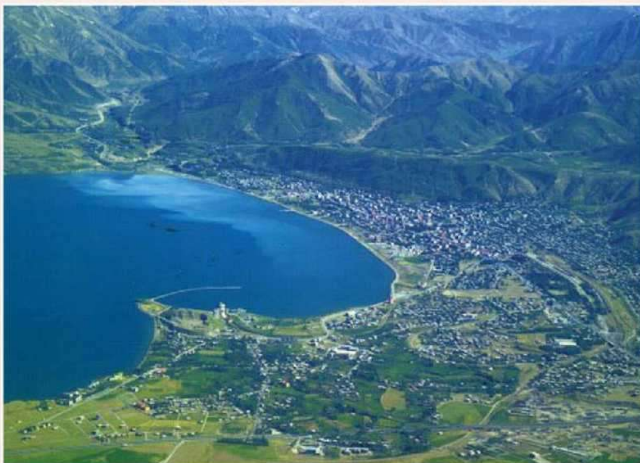
بازئیری ته توان - باکووری کوردستانی

Kovareka heyvane ya rewşenbîrî giştîye li Amêdiyê derdikevît