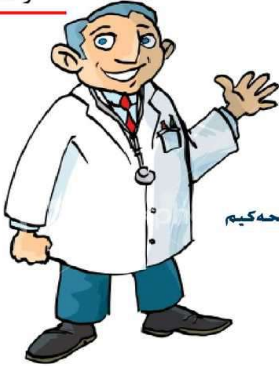
د. ناستی عه بدله کیم