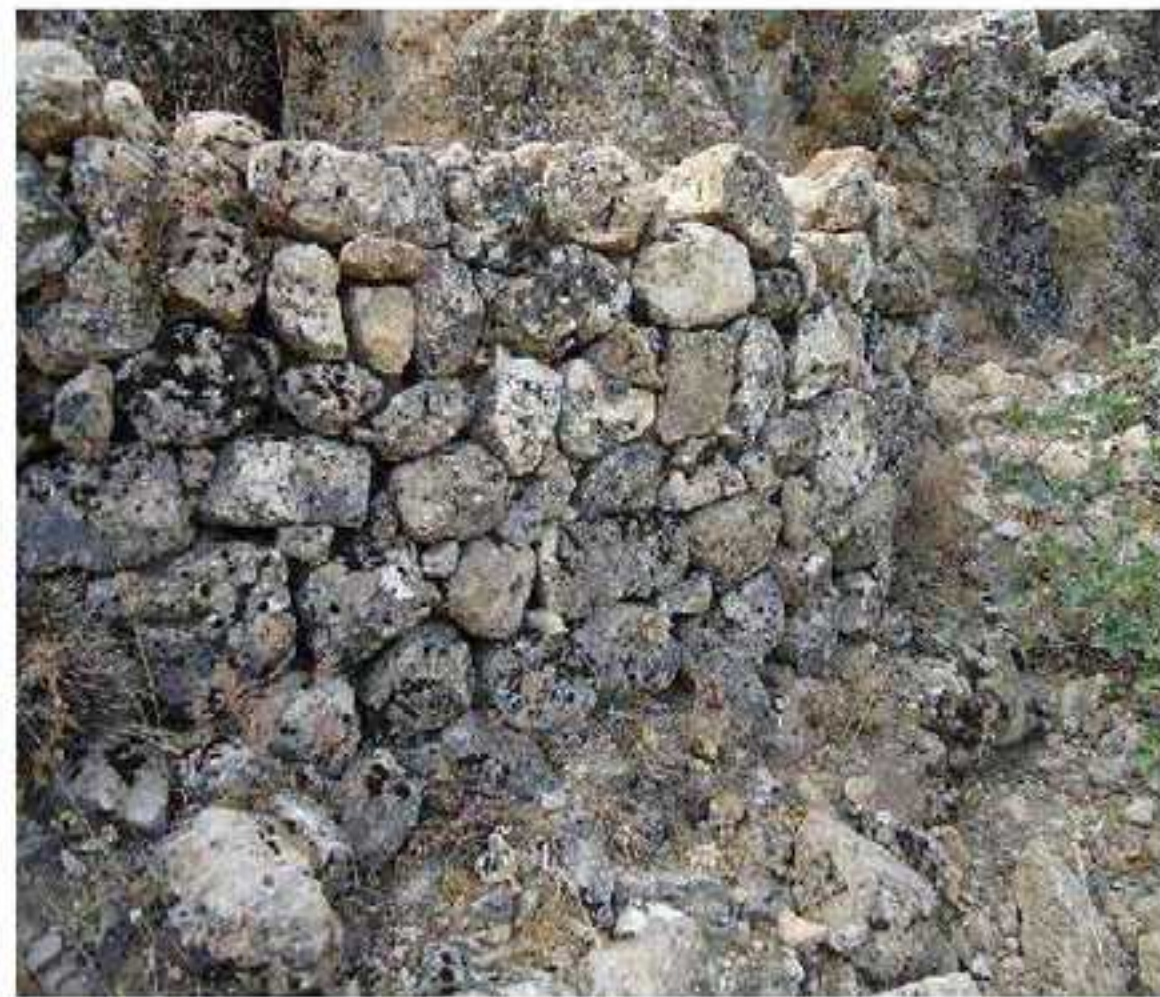
پارشا ميترگا بلباس