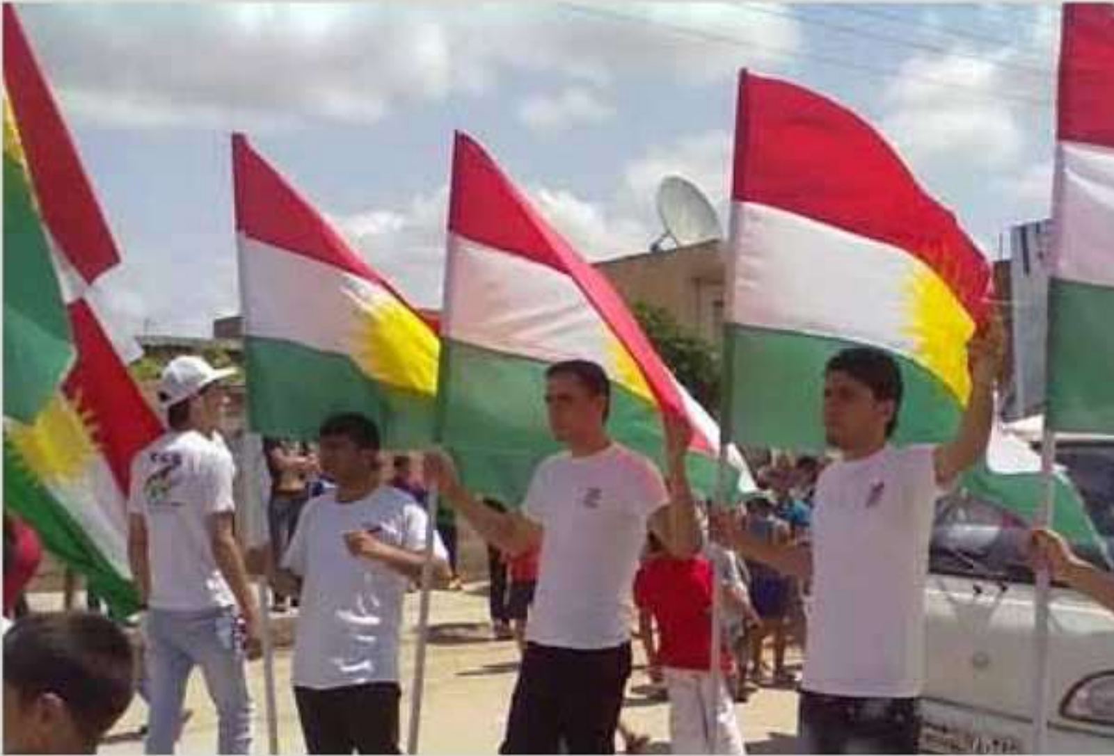
پەیدا بوونا هزرا نەتەوی ل دەف ملهتی کورد