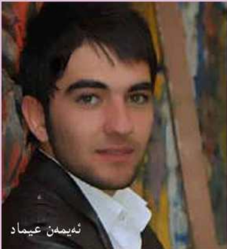
نایمان عیما د