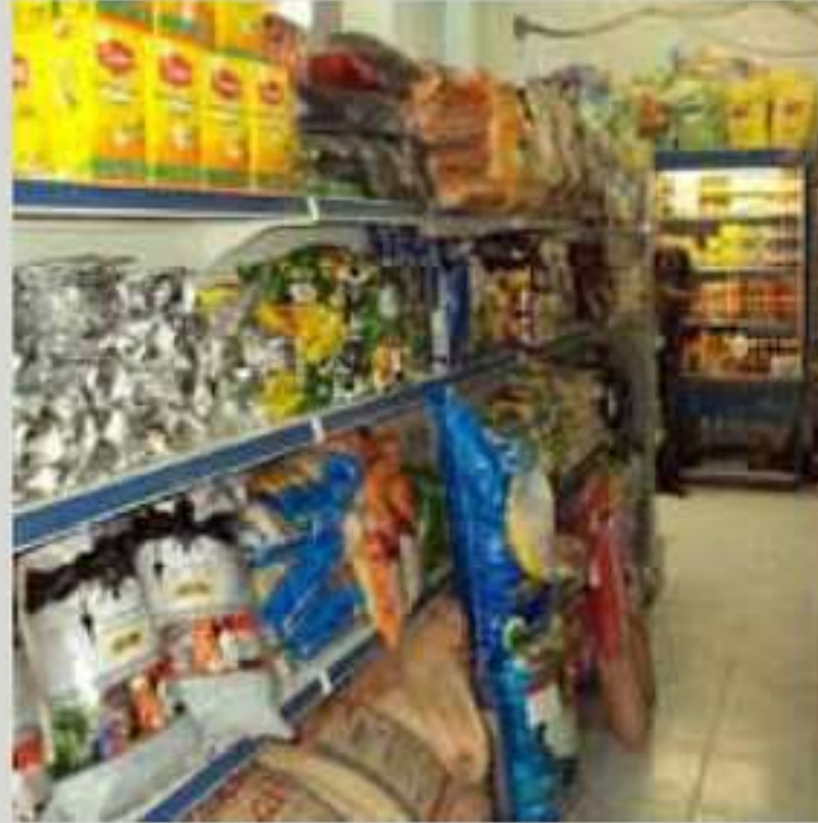
رەمەزان و جەژن و بازار