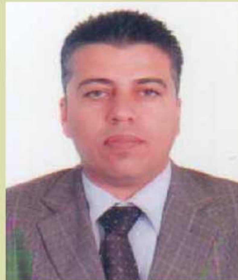
مستهفا عبدالرحمن نورهانی

مروف دژانسا دونیایی دا لهسهکی کهرستهی و خودان ههستین کهرستهیدا دژیت