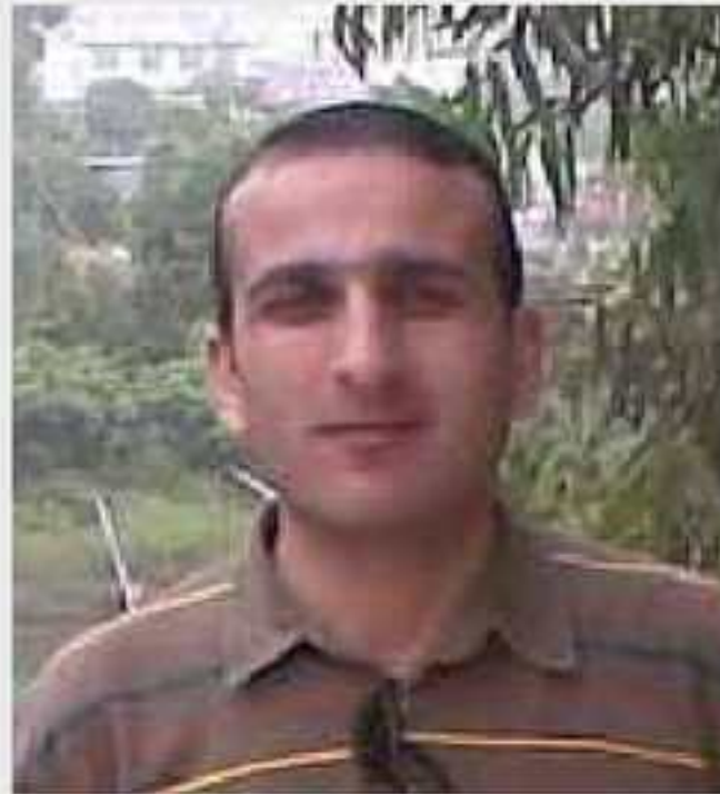
مافیهرور. نهرسه لان مستهفا نیروهیی

خوه یین دیترو و ل بن پهر و بالین خوه. پشتی بوورینا ده می پیدقی و دهرکهفتنا چیچه لۆکان ژ هیکی نهو باز ژی ژ هیکی دهرکهفت و ب وئ هزری کو دیکلهکا بچوکه د گهل چیچه لۆکین دیترو ژبارا خوه ب ریقه دبهت و گهلهک جارن دا بیترته چیچه لۆکان: خوزی بازهک بامه و شیانین فرین من هه بانه!!! و چیچه لۆکین دیترو دا بیترتی: ب تنی تو دیکلهکی سادهیی دئی چاوان بیه باز و دئی فری!! ههر چهند نهو ب خوه بازهک بوویه و شیانین فرین ژی هه بوینه، لی کاودانان و نهقین د گهلدا وهسا بو دیار دکرن کو نهو هیقی چو جارن جیهه جی نابیت و نهو بازی بچووک ژیا وهکو دیکلهک ههتا مری!!