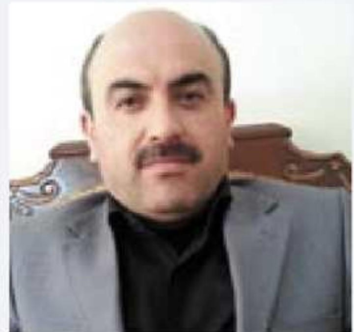
د. نه جیب سه عید رهشید تایبه تهمه ندی نه خوشیی خوینی