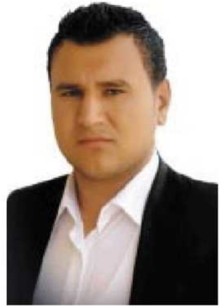
سه گمان به هجعت

نه گهر هم بهر یخو بدهینه ژیانې، بېگومان ژيان پیدغی ب(خوه گوربکرنې) ههیه، ههتا دسروشتی دا ژی نهف چهنده بومه دیاردبیت، وهکی تهفنیپرکې دهمی دهیلیقانکا خودا هیکا دکهت و پستی هنگی دئ رابیتن تهفنهکی ل دور هیکن خوه نالینیتن دا بهرچاقا بهرزهبیت و بهینه پاراستن، پستی هنگی تهفنیپرکا دایک بئ هندئ کو هزارا رهحتیا خوه بکهت دئ رابیت بهردهوام بو تیشکیت خوه ل خوارنئ گهریت وهختئ تیشکیت وئ مهزن بوون و بهیز کهتن کو نهو بخو نیچیرئ بکهن و خوارنئ پهیدا بکهن ل قئ دهمی تهفنیپرکا دایک ژبهه وهستیان و ماندووبونئ دکهفیت و دمريت، یا ژقئ سهیرتر نهوه کو جوردهکئ دیبئ تهفنیپرکا بئ ههئ پستی تیشکیت وئ ژ هیکا دهردهکن نهو تهفنیپرک لهشئ خوه وهکی خارن ددهته وان تیشکا، ههرچهنده دبیت نهفه تشتهکئ وهسا