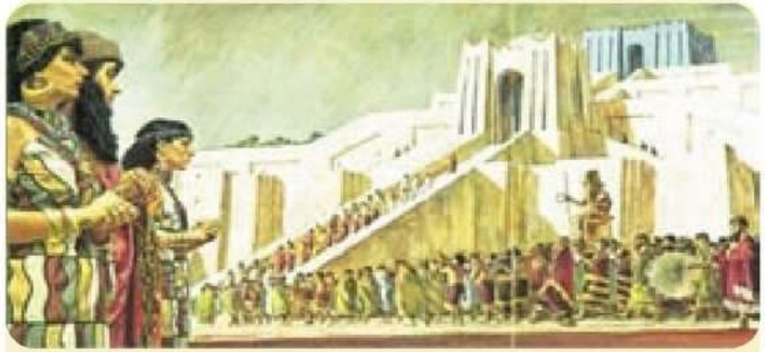
شيوه كاريا جيهانڪي روژهلتناسڪي و سحرا شارستانيا روژهلتنڪي