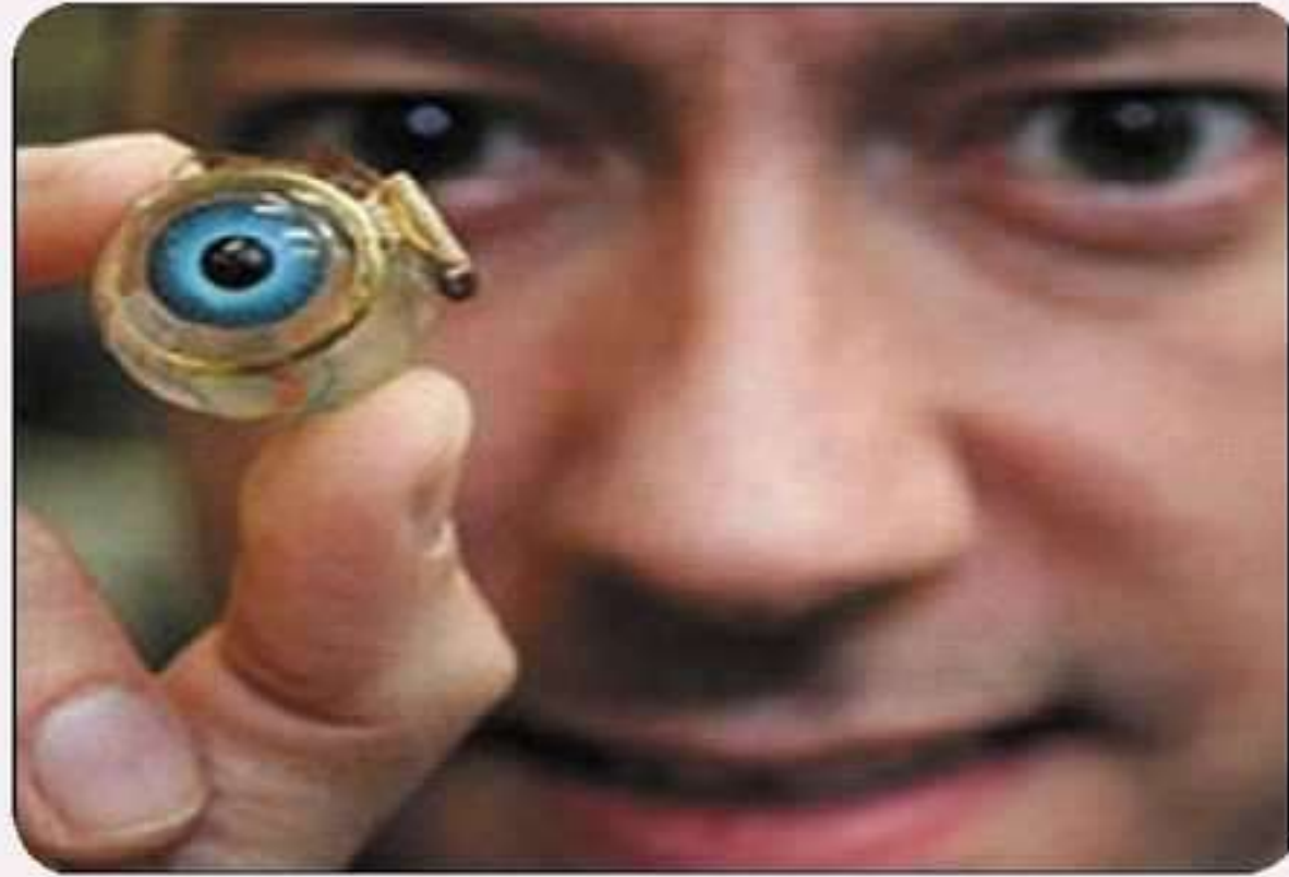
چاههڪي نه لڪترونڪي بيناهيا نابينان دزقريئيت