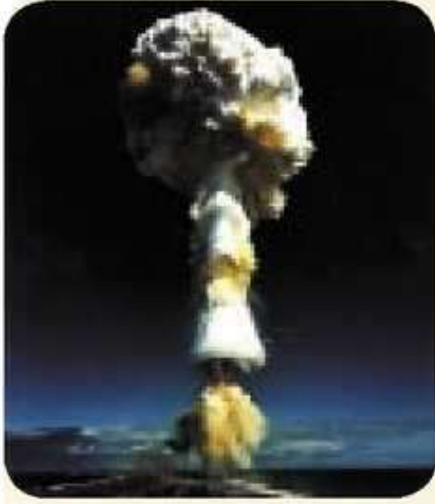
بومبا نه توهڪ