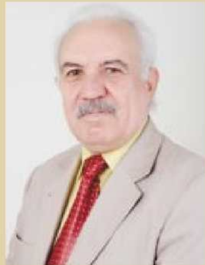
بهره‌فکر و ویرگیان رمزی ناکریمی - دهوک

شهرین ئوسمانی و فارسی و شهرین ناپلیونی، چیروکین شهرا دگه‌هشتنه ناشویی هونرمه‌ندا، نانکو هونرمه‌ند بخوژی دگمل شرفانا دچوون و ب که‌فالتی خو وینه دگرتن و داخبار دبوون ب سهقا و هه‌وایتن وان ددیتن و پی حیبته‌تی دبوون، وه‌کی که‌فالتی (بهره‌فانکاریت قاهره) پی جیروویه و که‌فالتی (نهرین ل یاقا هه‌فروشی تعاونی بوین) پی جروی و (کومه‌کا عه‌ره‌با) پی جویا و هه‌روه‌سا هنده‌ک که‌فالتی هه‌ین هونرمه‌ندا ییتن وینه‌کرین ده‌می دگمل ناپلیونی بهره‌ف روزه‌لاتی چووین و ژوان که‌فالتی (شهری نهبی قیر) یا ل موزه‌خانا کوندی و که‌فالتی (شهری نهرامان) کو سه‌رکه‌فتنا ناپلیونی بهره‌جسته دکمت و هاتیه پاراستن ل موزه‌خانا فره‌نسا و هه‌روه‌سا هنده‌ک هونرمه‌ند ل سه‌ر رتبازا (جروی) چووینه وه‌کی (جیران) دکه‌فالا خویا پاراستی ل قیترسای نهری ناپلیونی دیار دکمت ده‌می بهره‌فانیکه‌ترین ژ قاهره پاداشت دکمت.