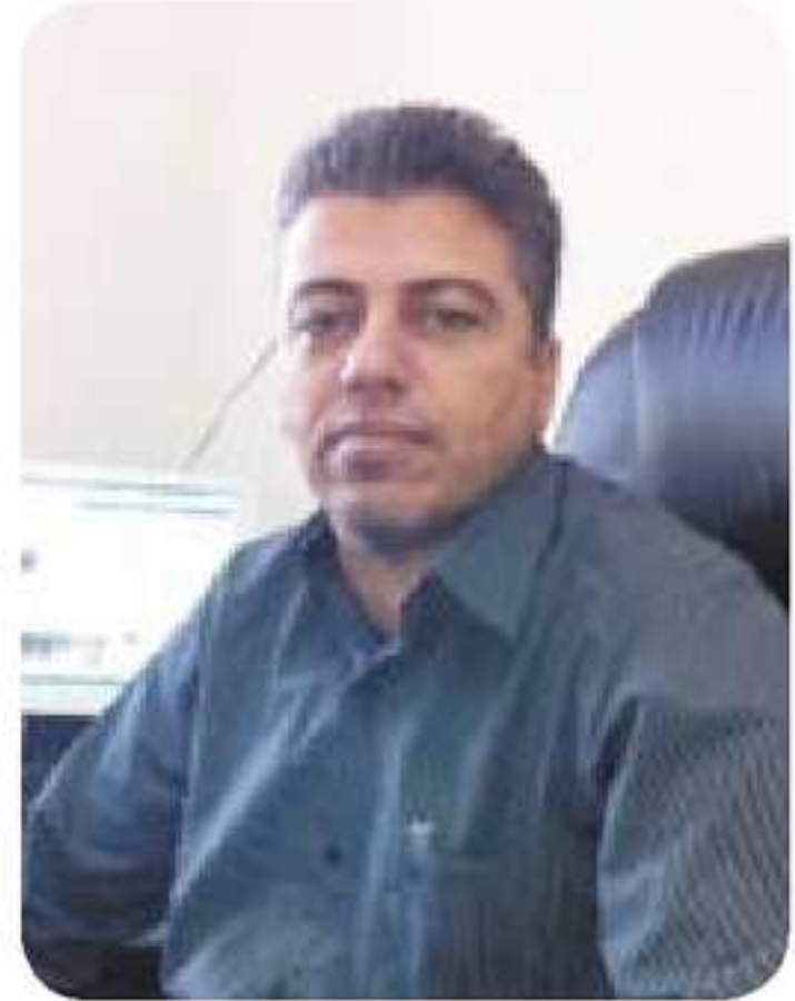
مستهفا عبدالرحمن نهره دنی

چاف ئیک ژ پینچ ههستین مرؤفینه،ومرؤف بریکا چاقان دبینیت وفیر دبیت ودزانیت، ونهگمر چاف نهبان مرؤف فیری خواندن ونقیسین وکارین دهستی نه دبوو ونهگمر چاف نهبان مرؤفی رنگ ژیک نه دنیاسین وسروشت نه دیت وگیانه ودرین کههی وکیفی ومفادار وزیان بهخش نه دزاین وژیک جودا نه دکر و نهگمر چاف نهبان هیچ پیشقهچونهک پهیدا نه دبوو بهلکو ژیان دا بشیوهکی خولهکی ل دور خو زفریت بی پیشکهفتن، چونکه چاقن مرؤفی فیری همر تشتهکی دکهن و چاقن همر دیمهن و وینه وکار و تشتهکی چ پی ب گیان بیت یان بی گیان وکهرستهی بیت دبینیت و قهدههیزیه میتشکی مرؤفی ومیشکی مرؤفی ژی وی تشتی هنارتی شروهه دکته و یاسایا بو دانیت وریک دئیخیت ودئیخیه ژیر کونترولا خوقه، پیدقیه بزاین چاف درهوا ناکهن ودراستگونه ب شهگوهاستنا همر دیمهنهکی یان وینهکی ودبیت نهگمر چاف نهبان بیرا مرؤفی ل گهلهک رویدان و بوهرمان نههاتبانه یین ب سهر مرؤفی یان گهلی مروقیدا هاتین وپورین چونکه چاف دشین وی دیمهنی همر وهکو فلمهکی سینهمایی همر گاغا دقیت نشان بدت بی کیم وکاسی و همر وهکو نهو تشتی بهری ۳۰ سالا هاتیه رویدان ودیتن نوکه همر ب وان رنگ رویدانا دبینیه شه، چاقن مرؤفی دکهنه کسین خودان شیان وبههره وبلیمهت و زانا وشارهزا وچاقن مرؤفی بهرف نهمانی دهن و مرؤفی دکهنه کسهکی