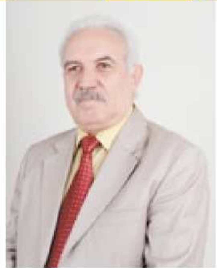
ب و : رمزی ئاکرمیی

ئەلزای (د روماننا) (اغفاوه لمیموزا) ئەف ئەدیبی ناقدار هندهک ژێده رین جهزائیری وی پهسندکەن ب ئیسپانیی سیخور و ئەفە راستیهکا گرتدایه ب (سرقانتس) ی لهشکەری کو روشه نیبیریا شهرین خاچپه ریس ل دهف ههبوو و کهرب و کینین دژی موسلمانا پشتی کەفتنا ئەندهلوسی و دامهزراندنا دادگههین پشکینین وەل وی کرن وەکی پرانیا ئیسپانا تولا خو ئەکەن ژ سێ ملیون موسلمانا و باکوژی ئەفریقا و تایبەت جهزائیر نارمانجا وان یا ئیکتی بوو، ژ سەردهمی شاه (فیلیپی دووی) ول وی دەمی سرقانتس و برایی وی (رودریگو) چونه دگهل ههوا (دیگودی ئیرینا). ل سالا ۱۵۷۰ پشکداری دگهل کر دهری (لیبونت) یی ناقدار دژی تورکا ب سهروکاتیا (عهلی پاشا) و ئیک ژ میرین جهزائیر و دیروکنقیس دبیژن دهریا و ناگر بوونه ئیک تشت دوی شهری دا و سرقانتسی تیدا دهستی خو یی چهپی ژدهستدا، بهلی ما ساخ داکو ئەفسانهیا (دون کیشوت) ژدایک ببیت ول سالا ۱۵۷۳ پشکداری د دوماهیک شهردا کر ل دهف دهرینکین تونس دژی تورکا ب سهروکاتیا (عهلی ئەلعج) و (سنان پاشا) ول بهنده رین ناپولی و پالیرمو