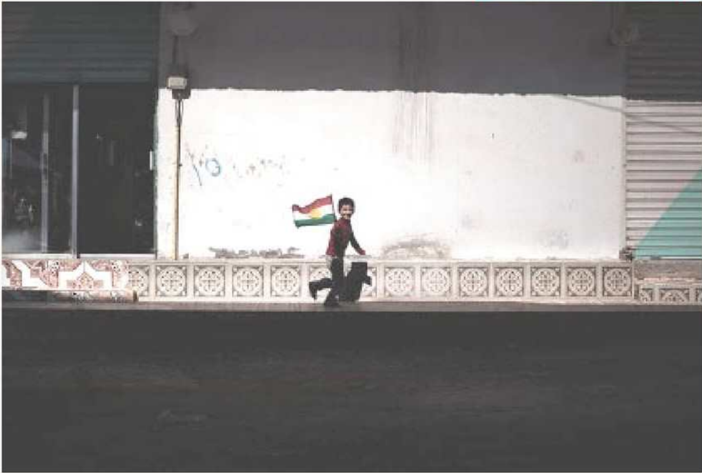
زارویهکی کورد ئالایی کوردستانی ل سەر وکانیی - سوریا هەلدگریت

هه‌یزین رژیمی ب ریکا هه‌رشکرنا سەر ده‌قهرین باشوری رۆژه‌هلانی کو هه‌یشتا یا ل ژیر رکیفا سوپایی سوری. هەر ژ شه‌ری جیهانی یی ئیکتی، گه‌لی کورد ب زیان قه‌یکه‌تی سهره‌کی یی شهر و کیشه‌یی ده‌قهر رۆژه‌هلانا ناڤین ده‌یته هژمارتن. نه‌ا ل نه‌قی ده‌قهری، نه‌ سه‌یره هنده‌ک بو‌یه‌ر و ده‌وه‌رانین حنی‌ر و نه‌نتیکه‌ سه‌ره‌لبده‌ن، نه‌ سه‌یره ژی کو نه‌ف گروپین نه‌ژادی نه‌وین ژ که‌فنه زه‌ماندا توشی ته‌په‌سه‌ری و په‌رشبوونی بو‌وین وه‌کو رولی پاشا چیکه‌ر بو‌ پیکه‌اتا رو‌یی ده‌قهری بو‌ سالین داها‌تی رولی بارز بگه‌یرن.