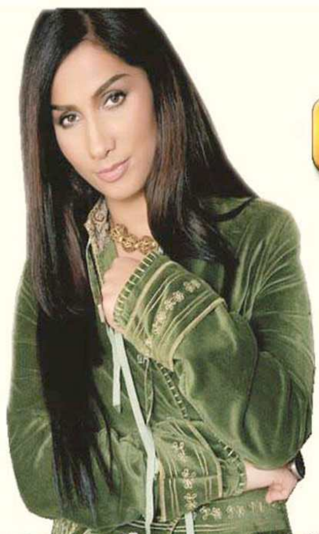
روژىن شەپبەران دىپىر شىتە زەلامان