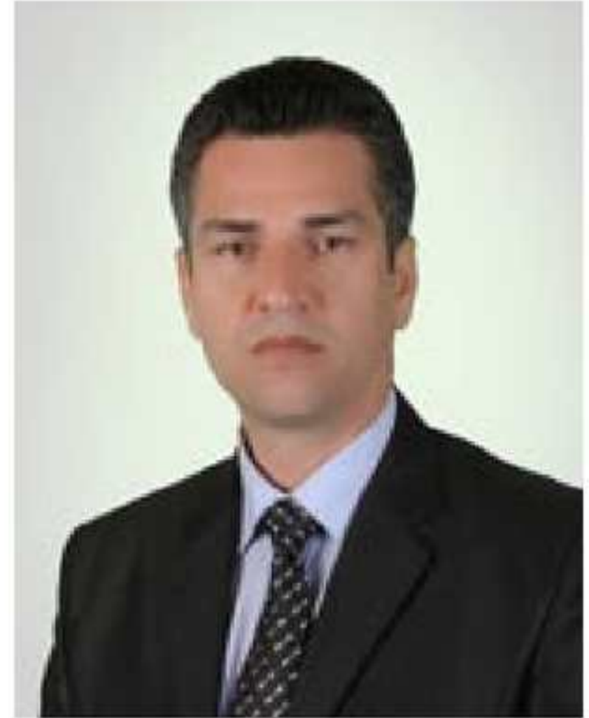
سامى بنىامىن رىكانى

ئەف گوندمە ب شكەفتىت كونيشكا ھاتىە نىاسىن وئەف شكەفتە ب دوو دمرگەھىت مەزن ھاتىە كولان، ئىك ژوان ب تەرزى چار گوشەيە وىي دى ژى ستوونى يە و سى پەنجەرىت بچويك يى چوارگوشەيى ھاتىنە قەكرن بۇ روناھىن دەما مە ھەقدىتەك دگەل ئىك ژخەلكى گوندى ب ناقى جەبارعومەر ژدايكبويى ۱۹۴۸ى كرى بۇ سىلاقى گووت:كولانا قان شكەفتا نە ل بىرا مەنە و نە ژى ل بىرا بابى من، بەلى ژباب و باپىرىت مە بوو مە ھاتىە قەگىران كول دمەكى دا و بەرى ب سەدان سالان د كەقرى را ئەف شكەفتە ھاتىە كولان ل وى دمى دا شەر دمشە بوون دىاردىبتن كو وان بۇ خو قەشارتى ئەف شكەفتە كولا بىتن، شكەفت ژى ژدوو ژوران ھاتىە كولان ئىك ژوان يا مەزنە و جەھىت روونشتى تىدا ھاتىنە چىكرن ب كەقرى، مينا