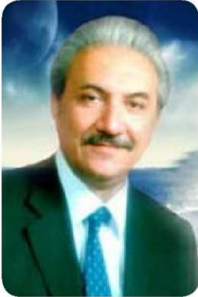
هه‌لبه‌ستقان به‌درخان سندی

هه‌رتیکسته‌کی ئه‌ده‌بی بیج ئهم بخوینین ژ دو ئالیان پتیک دهیت، کو ناهه‌رۆک و روخسارن، هه‌رقوناغه‌کا ئه‌ده‌بی جوداهیتت به‌رچاڤ دیار دبن د ئان ئالیان دا و د تیکستیت وان قوناغاندا. نالیی روخساری ژێ وه‌کی هاتیه‌ خویا کرن هنده‌ک تاییه‌تی بیتت خو هه‌نه‌ دناڤ قوناغیتت شعری دا چ هه‌لبه‌ستا کلاسیک بیت، یان هه‌لبه‌ستا نوی، ئه‌ڤ چهنده د هه‌لبه‌ستیت به‌درخان سندی دا، کو ب ئیک ژ نقیسه‌ریت به‌رنیاس دهیتت هژمارتن دا ددیارن. بو وئ چهنده‌ی کو ئهم بشین هنده‌ک ژ سیماییت نوپکرنی د هه‌لبه‌ستیت وی دا دیار بکه‌ین، ب تاییه‌تی ژ لایی روخساری ڤه، مه هه‌لبه‌ستا (دهمی بیر تینه بیرا من، پارچا ۲) هه‌لبه‌رتیه، کو دئ ئان ئالییتت خاری کو دکه‌ڤنه بن سیبه‌را روخساری ل سه‌ر وئ پارچه هه‌لبه‌ستت شروڤه که‌ین. ئه‌و ژێ ئه‌ڤه‌نه: