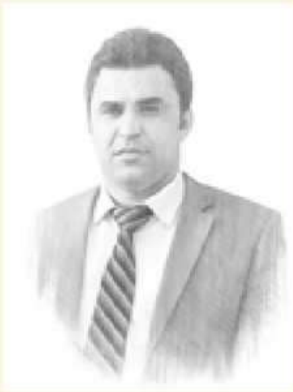
دهقند گوهه رزی