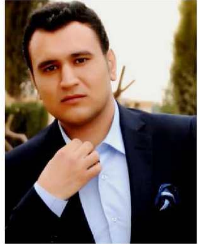
سه گنان به هه مت

بهیز ل ئیراقی بو نه گهری نه مانا باومریا خه لکی ئیراقی، ههر دیسان بو نه گهر کو رهوشا ئیمناهی یی روژ بو روژی بهر ب خرابیی بچیت و د دمه کی کییم دا دموهتا تروریستی داعش شیای دمهت ب سهر گه لهک دمه ریت ئیراقی دا بگریت، ههروهسا دموهتا تروریستی داعش د قیا هه مان سیناریو ل کوردستانی ژی دووباره بکهت، بهلی ب خوراگریا پیشمه رگهی د سهنه گهریت شهری دا ژبو پاراستنا کوردستانا مه بو نه گهر ههتا خه لکی عیراقی ژی قهستا کوردستانی بکهن، نه قه ژی ویره کیا هیزین پیشمه رگهی نیشان دمهت، لهوما پی دققی یه ل سهر خه لکی مه ئا لیکارین هیزین پیشمه رگهی بن ژ هه موو ئا لیه کی و ئەم هیقیدارین خه لکی مه نه بیته (ستوونا پینجی) ژبو به لاقکرنا گوٹگوٹکا د ناف خه لکی دا و شکاندنا ورمیا پیشمه رگهی و چی کرنا ترسی دناف خه لکی دا چونکی ئەف یهک دی باندوره کا نیگه تیف که ته سهر جقاکی مه دی بیته نه گهری شیواندنا ژی ئاسایی یا خه لکی چونکی دوژمن بهردموام هه و لدمت قان گوٹگوٹکا دناف خه لکی دا به لاف بکهت ژ بوچی کرنا ترسی وه ههروهسا بو ئارمانجا ب ساناهی ئیخستنا ئیرشین خوه داکوب ساناهی ب سهرکهفن. چونکی شهر یان بیژین جهنگ ب که لهک شیوا د هیته کرن و ئەف