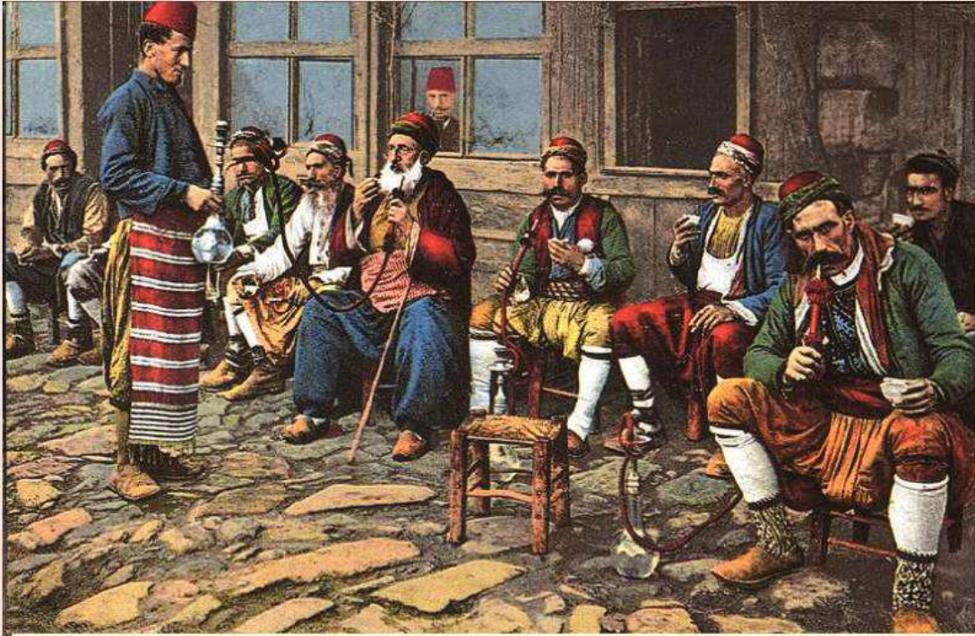
کەفالهکی ژ نینتەرینتی