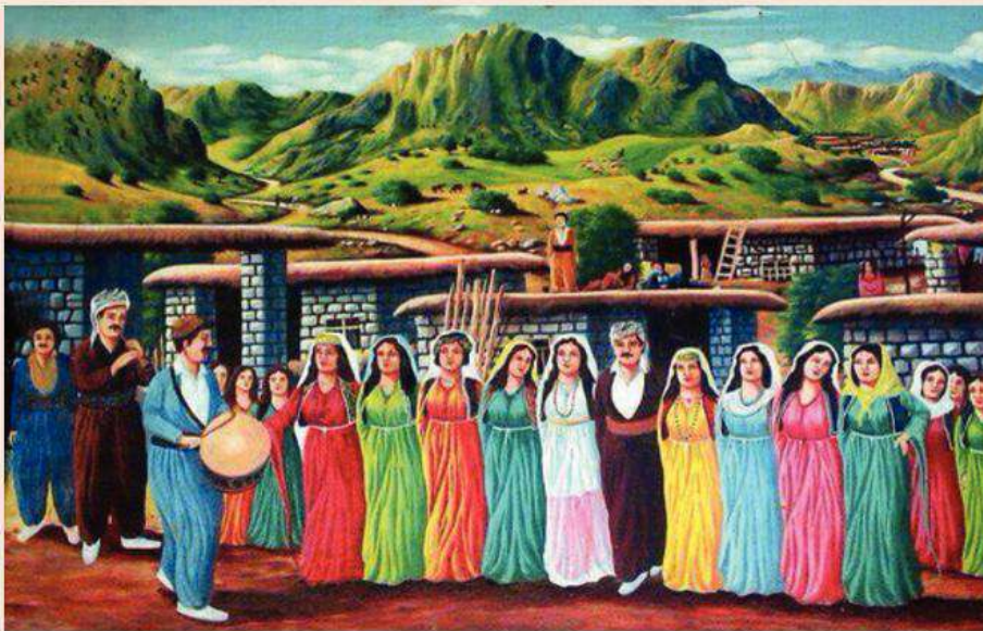
که فانه ک ژ نیته رنیتي - داوہته کا کوردهواری

سترانیت فولکلوری مادده یه کي بنه کوکا موزیکا فولکلوری یه، کو ټه و ژي ټاواز و ستران، بشی ټیکي شارهزا و بسپووریت نه مازه د فولکلوری دا سترانیت فولکلوری ل سهر چنه د رهنګه کا پارقه کرینه؛ ژ وان (سترانیت شولی کو ټه و ژي سترانیت دروینی، بیړی، دارفانی، کاروانی، شثانی و پاله یی)؛ سترانیت هه لکه فتا وه کو هه لکه فتیت «فه گوهانژتنا بویکا، تازیا و دینی» و دیسا سترانیت روژانه