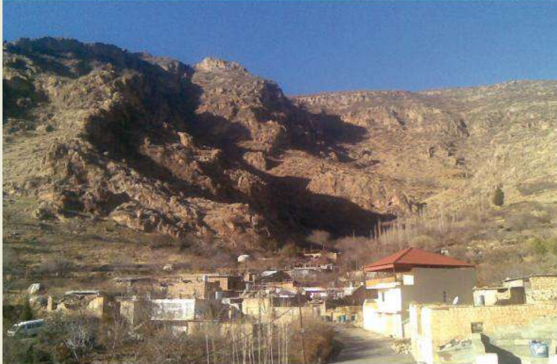
دیمہنہک ژ بائیرکی بامہرنی

دکھفندا بامہرنی ہہرسئ دینیت تہسمانی (جوهیانی و فہلانی و ئیسلام) حہواندینہ، ہہرسئ دینیت نافبری وہکی برا ژین و ژیارا خو پیکفہ بۆراندیہ، ہہروہساب پھنگہکی خوہسہر ہہر دینہکی ریورہسمیت خو بریفہدبرن. پیزانین دیاردکھن کو دینئ فہلا ل بامہرنی ہہبوو، بہلی بتنی ل چہرخئ چاری زاینی نافریہک پی دہیتہ دان، کو بامہرنی دوی دہمی دا بنکہہئ مہترانخانا دینئ فہلا بوو و قہشئ بامہرنی نافئ وی (قہشہ ئیلیا) بوو، مہترانی بامہرنی نافئ وی (مہتران شملی) بوو. بہلی مخابن کتیبیت دیروکی ہژمارا جہواریت فہلا ل بامہرنی نہدیارگریہ، دیسافہ رھنگئ ژین و ژیارا مروقت فہلا ل بامہرنی دیارنہگریہ.