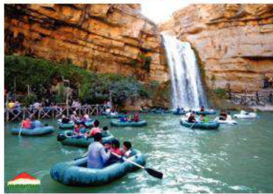
سيلافا گه لىي عه لى به گى

گهريان و سيرانگه يى كهرته كى ئابوورىه، ئەف كهرته ل هه مى دونياى ب كهرته كى ئەكتيف دهيته هژمارتن. ئەگەر حكومت ب پلان كار بو ئافاكرن و سه رتيخستنا فى كهرتى بهر كته تى ئابوورى بكهت و بدروستى بهرفه ريزكرنى تيدا بكهت و كهرتى نه مازه ژى پالدهت كو رولى خو د فى بيافى دا بگيريت. ههروه سا حكومت بو پيش تيخستنا فى كهرتى دشيت مفاى ژ هزر كه را بكهت و ل وى ده مى ئەف كهرته دى شيت سه ركيشيا پيشكه فتنى كته و د نافا وه لاتی دا سه ركيش بيت، ژبهركو گهريان و سيرانگه يى وهكى كانيا داهاتى دهيته هژمارتن، چنكى چ مه زاخنتيت مه زن تيناچن و