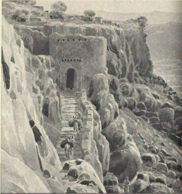
شکلگه‌کی دهرگه‌هی سه‌قافا - نامیدی