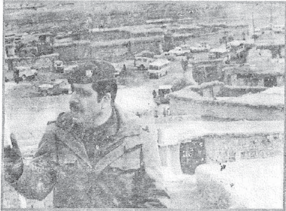
نزار خه زره جي له کاتي نه نفا کورني گوندي عسکهر دا