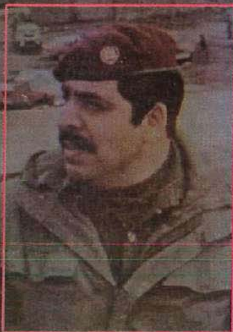
تۈپتەرەن ھىمەن باقر عەبدول بەرھەم عومەر عەبدوللا

ۋىژىنەۋەيەكى مەيدانىيە لەھەردوۋ ناھىيە شۇرش و رزگارى